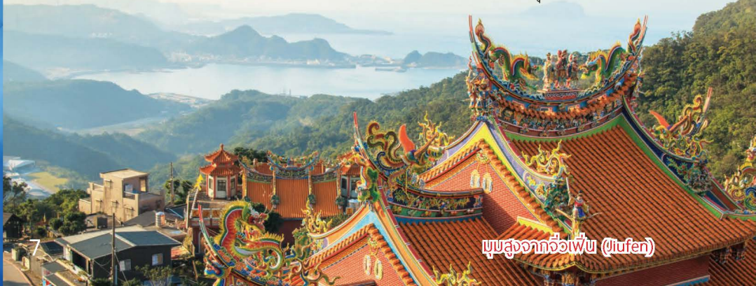
มุมมองจากจื่อเฟิน (Jufen)

ฤดูหนาว (ธันวาคม-กุมภาพันธ์) สัญลักษณ์ความหนาวเย็นมาเยือน อุณหภูมิเฉลี่ยประมาณ 15-20 องศาเซลเซียส ในฤดูหนาวช่วงเวลากลางวันจะสั้นที่สุด เพราะพระอาทิตย์ตกดินราว 5-6 โมงเย็น เป็นช่วงที่เหมาะสมแก่การท่องเที่ยว เพราะอากาศเย็นสบาย เดินชิลล์ได้ทั้งวัน และเป็นช่วงที่ฝนตกน้อยที่สุดของปี ซึ่งกลายเป็นช่วงที่นักท่องเที่ยวค่อนข้างน้อย จะเยอะแค่เพียงปีใหม่ และเทศกาลตรุษจีนเท่านั้น