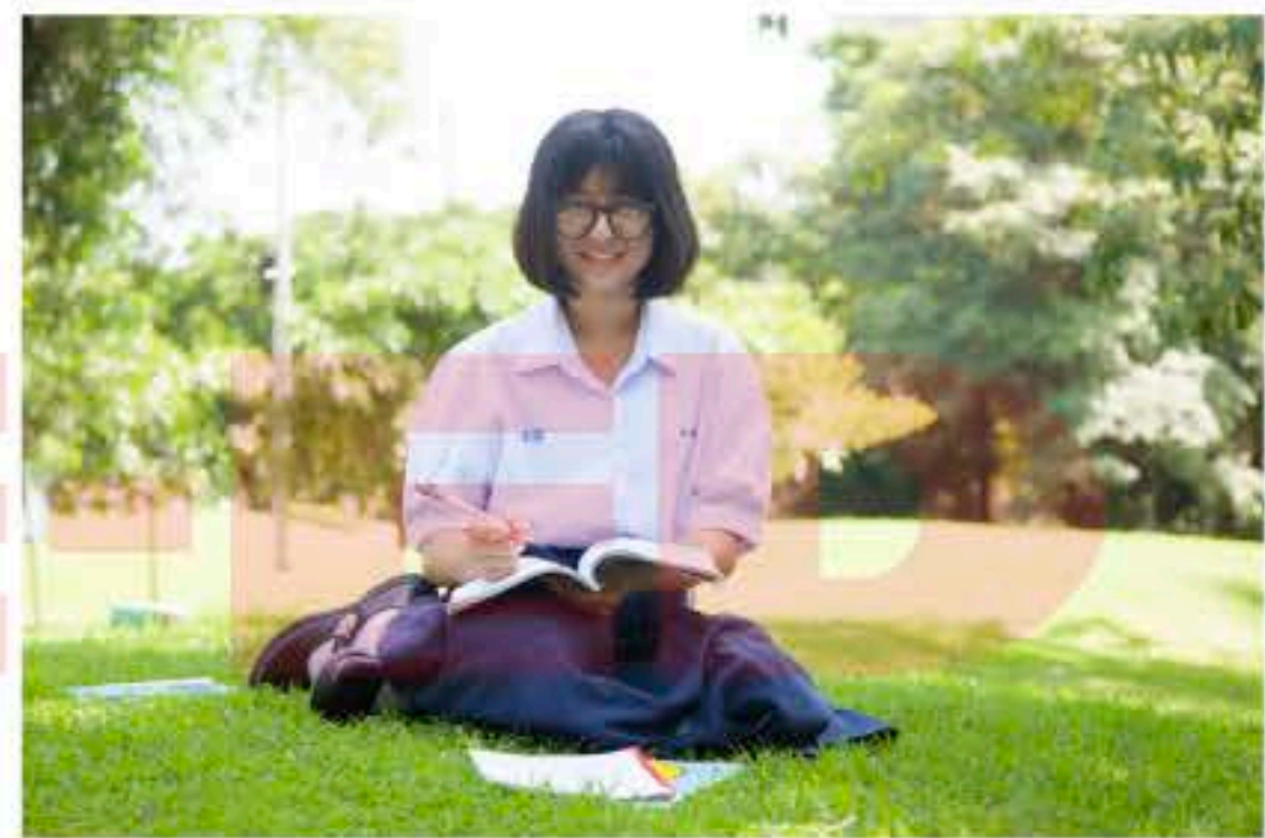
วัยรุ่นตอนกลาง