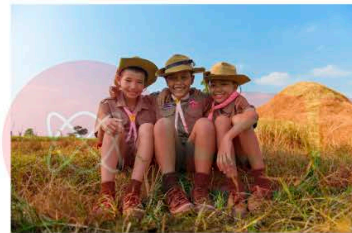
วัยรุ่นตอนต้น

วัยรุ่นตอนปลายเป็นวัยที่เข้าสู่วัยผู้ใหญ่ ผ่านวัยรุ่นมาแล้ว 2 ระยะ พัฒนาการทางเพศคงที่แล้ว ทำให้วัยนี้อารมณ์เย็นลง มีการคบเพื่อนต่างเพศ มีความรัก มีความสัมพันธ์ที่ยั่งยืนกับเพศตรงข้าม และมีเพศสัมพันธ์