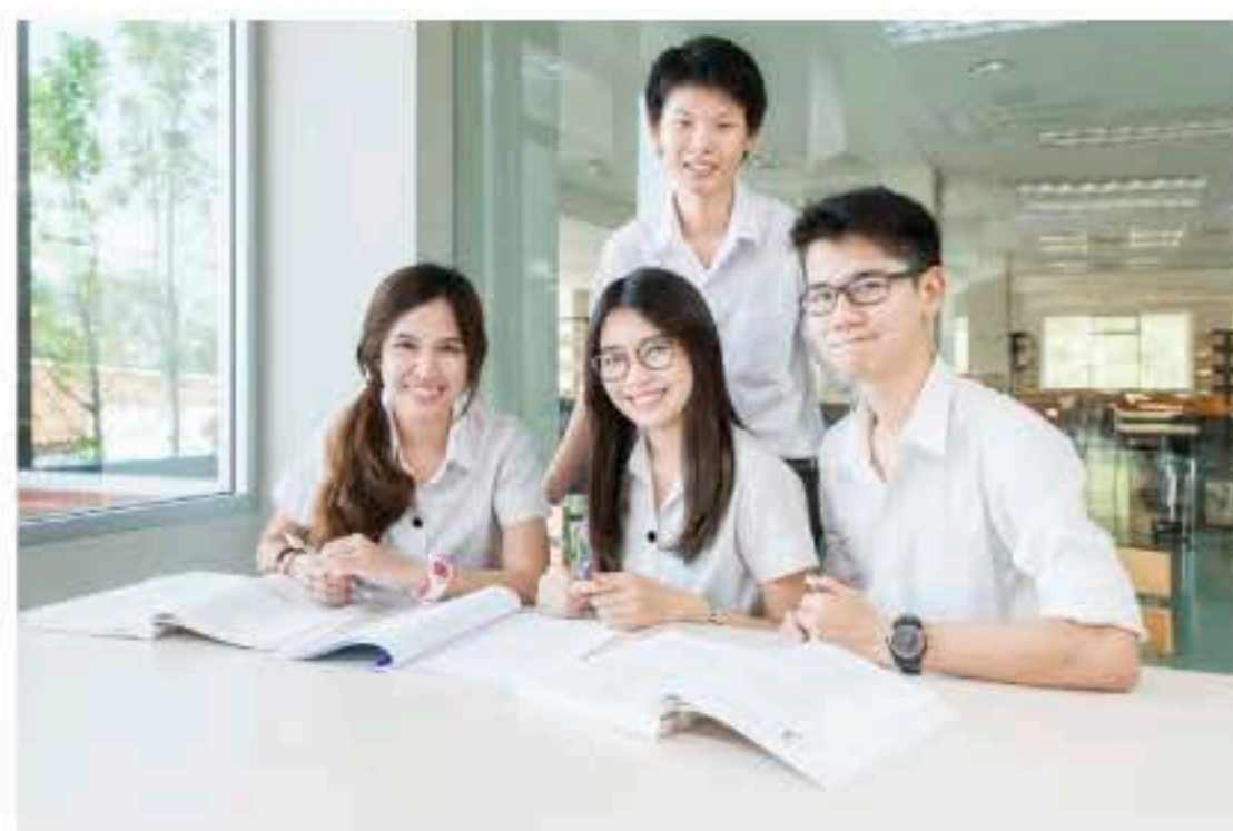
วัยรุ่นตอนปลาย

รูปที่ 1.1 วัยรุ่นจะแบ่งเป็น 3 ช่วงคือ ตอนต้น ตอนกลาง และตอนปลาย