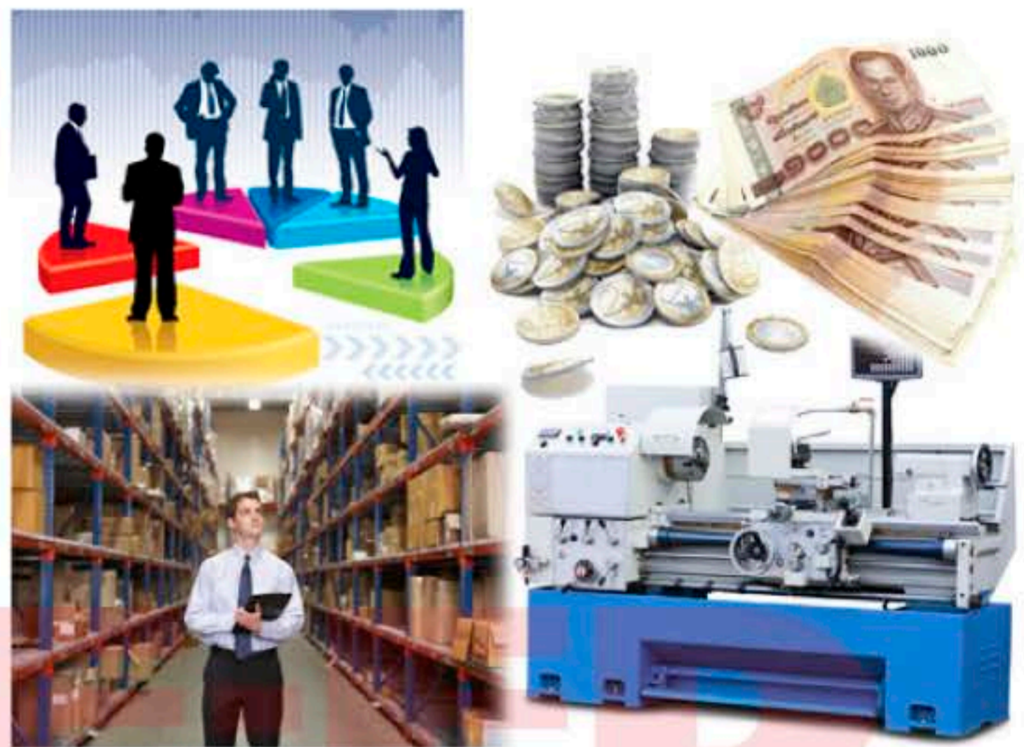
รูปที่ 1.1 ปัจจัยพื้นฐานของการประกอบธุรกิจ

2. เงินทุน (Money) เป็นปัจจัยสำคัญสำหรับการลงทุน เพราะหลายๆ ปัจจัยที่นำมาใช้ในการลงทุน จำเป็นต้องจัดหาได้ด้วยเงิน ไม่ว่าจะเป็นการจัดซื้อที่ดิน การก่อสร้างโรงงาน การจ้างบุคคลเข้าทำงาน หรือค่าใช้จ่ายต่างๆ ที่เกิดขึ้นในการดำเนินธุรกิจ ซึ่งเงินทุนในที่นี้หมายถึง เงินสด และทรัพย์สิน รวมถึงเงินกู้ด้วย