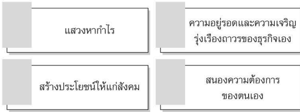
รูปที่ 1.1 แสดงความมุ่งหมายของการประกอบการ

การประกอบการหรือการประกอบธุรกิจ มีจุดมุ่งหมายหลายประการ ดังแสดงในรูปที่ 1.1 ได้ดังนี้