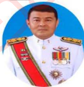
พ.ต.อ.วิสิฐ วงศ์เมือง อธิบดีกรมสอบสวนคดีพิเศษ