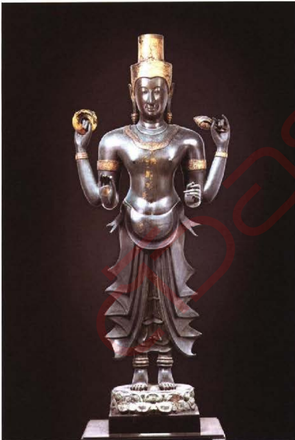
พระวิษณุ ศิลปะสุโขทัย พุทธศตวรรษที่ ๑๙ - ๒๐

การปกป้องคุ้มครองและการอนุรักษ์มรดกทางวัฒนธรรม ด้วยการจัดทำระบบข้อมูลสารสนเทศมรดกทางวัฒนธรรมทุกแขนงให้มีความสมบูรณ์ ทันสมัยและครบถ้วน ปกป้องคุ้มครองมรดกทางวัฒนธรรม ทั้งโบราณสถานและแหล่งโบราณคดีอย่างเข้มแข็ง เพื่อไม่ให้เกิดการบุกรุกทำลาย ควบคุมไปกับการดำเนินการนำโบราณสถานที่ถูกบุกรุกกลับมาเป็นทรัพย์สินของแผ่นดิน โดยนำมามาตรการทางกฎหมายไปใช้อย่างเข้มแข็ง ในกรณีที่มีการบุกรุกและครอบครองโบราณสถานเกี่ยวกับแหล่งน้ำ เช่นในกรณีของการบุกรุกพื้นที่ของอ่างเก็บน้ำ (บาราย) คู คลอง และคูเมือง สำหรับงานที่เกี่ยวข้องกับเอกสารโบราณหรือเอกสารหายาก ทั้งในหอสมุดแห่งชาติและหอจดหมายเหตุแห่งชาติ จะต้องดำเนินการอนุรักษ์ไว้ตามกระบวนการวิชาการให้ทันต่อเวลาและสถานการณ์ ประสานความร่วมมือดำเนินการจัดตั้งเครือข่ายหรือนำเครือข่ายที่ได้จัดตั้งไว้แล้ว ให้เข้ามามีส่วนร่วมในการเฝ้าระวังและการปกป้องดูแลรักษามรดกทางวัฒนธรรมให้มากยิ่งขึ้น ดำเนินการจัดทำเอกสารหรือจดหมายเหตุการอนุรักษ์โบราณสถานที่เป็นมรดกโลกและโบราณสถานสำคัญของชาติให้ครบถ้วนสมบูรณ์ โดยดำเนินการในเชิงบูรณาการทางวิชาการกับสาขาที่เกี่ยวข้อง รวมถึงจัดทำ เสนอ ปรับปรุง พระราชบัญญัติ กฎหมาย กฎระเบียบต่างๆ ให้มีความทันสมัยทันยุคทันสมัย เพื่อเป็นเครื่องมือในการอนุรักษ์มรดกทางวัฒนธรรม