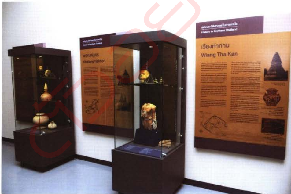
ห้องจัดแสดงนิทรรศการพิพิธภัณฑ์สถานแห่งชาติ เชียงใหม่

ด้านเอกสารหนังสือ พัฒนาระบบเทคโนโลยีสารสนเทศของหอสมุดแห่งชาติ และหอจดหมายเหตุแห่งชาติทั่วประเทศ เพื่อเชื่อมโยงข้อมูลสามารถให้บริการในระบบดิจิทัลที่ครบถ้วนสมบูรณ์