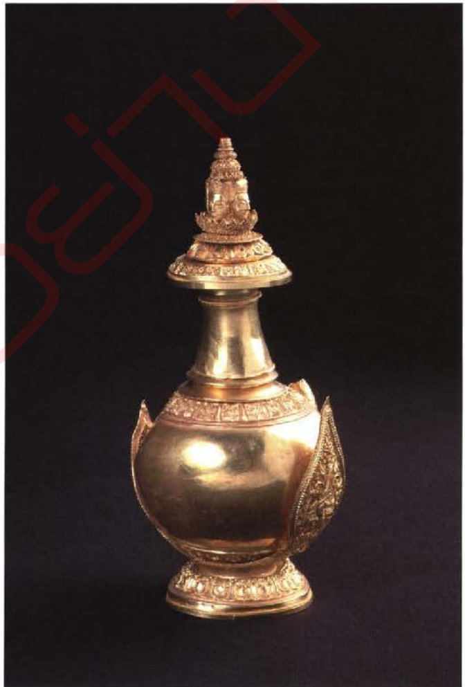
สุวรรณภิงคารทองคำระดับอัญมณี จัดแสดง ณ พิพิธภัณฑ์สถานแห่งชาติ เจ้าสามพระยา จังหวัดพระนครศรีอยุธยา

ด้านพิพิธภัณฑ์สถาน พัฒนาแหล่งเรียนรู้เดิมของกรมศิลปากร โดยกำหนดแนวทางปรับปรุงการจัดแสดง ภูมิทัศน์ และการบริการให้ได้มาตรฐานสากล ได้แก่ พิพิธภัณฑ์สถานแห่งชาติ พระนคร พัฒนาศักยภาพให้เป็นพิพิธภัณฑ์ระดับนานาชาติ พิพิธภัณฑ์สถานแห่งชาติ เชียงใหม่ พิพิธภัณฑ์สถานแห่งชาติ रामคำแหง จังหวัดสุโขทัย พิพิธภัณฑ์สถานแห่งชาติ ขอนแก่น พิพิธภัณฑ์สถานแห่งชาติ นครศรีธรรมราช พิพิธภัณฑ์สถานแห่งชาติ สงขลา และพิพิธภัณฑ์สถานแห่งชาติ เจ้าสามพระยา จังหวัดพระนครศรีอยุธยา พัฒนาศักยภาพให้เป็นพิพิธภัณฑ์ชั้นนำในภูมิภาคอาเซียน สร้างแหล่งเรียนรู้แห่งใหม่สำหรับประชาชน ได้แก่ พิพิธภัณฑ์สถานแห่งชาติ กาญจนภิเษก ให้เป็นพิพิธภัณฑ์ด้านชาติพันธุ์วิทยา จัดสร้างคลังกลางในสวนกลาง จำนวน ๑ แห่ง ที่ตำบลคลองห้า อำเภอลองหลวง จังหวัดปทุมธานี และคลังกลางในส่วนภูมิภาค จำนวน ๔ แห่ง เพื่อเก็บรวบรวมโบราณวัตถุ ศิลปวัตถุ ดำเนินการออกแบบอาคารจัดแสดง และกำหนดกรอบแนวคิดในการจัดแสดงนิทรรศการของพิพิธภัณฑ์สถานแห่งชาติ ๒ แห่ง เพื่อเตรียมความพร้อมสำหรับรองรับการจัดสรรงบประมาณ พุทธศักราช ๒๕๖๐ ได้แก่ พิพิธภัณฑ์สถานแห่งชาติ บ้านเก่า จังหวัดกาญจนบุรี ปรับปรุงให้เป็นพิพิธภัณฑ์