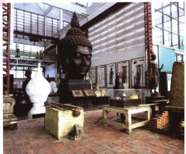
หอประติมากรรมดินเผา ภายในที่ทำการกรมศิลปากร

งานโบราณสถานและแหล่งโบราณคดี พัฒนาระบบข้อมูลสารสนเทศโบราณสถานและแหล่งโบราณคดีให้มีความครบถ้วน สมบูรณ์ พัฒนาระบบนำชมพื้นที่มรดกโลก โบราณสถาน อุทยานประวัติศาสตร์ และพิพิธภัณฑสถานแห่งชาติ เพื่อประโยชน์ในด้านการศึกษาและการท่องเที่ยว ดำเนินการวางมาตรการปกป้องคุ้มครองโบราณสถานและแหล่งโบราณคดี รวมถึงการบำรุงรักษา จัดทำแผนงาน/โครงการการอนุรักษ์และบูรณะตามลำดับความสำคัญ เช่น แผนแม่บทการอนุรักษ์และพัฒนาอุทยานประวัติศาสตร์ เมืองประวัติศาสตร์ และโบราณสถานสำคัญของชาติ ควบคู่กับการศึกษาทางโบราณคดีอย่างเป็นระบบ ทั้งในแหล่งที่มีความสำคัญระดับชาติและระดับนานาชาติ ตลอดจนพัฒนาบุคลากรสายงานโบราณคดีและการอนุรักษ์โบราณสถานให้มีทักษะ ความรู้ในการปฏิบัติงานตรงกับสมรรถภาพที่แท้จริง