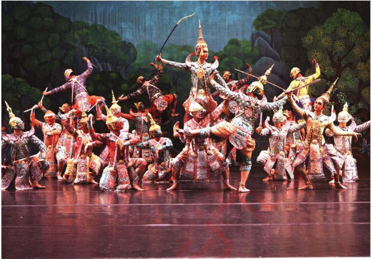
การแสดงโขนของกรมศิลปากร ตอนยกรบ

ชั้นนำของประเทศและของภูมิภาค ในทุก ๆ ปี ให้มีการจัดงานเทศกาลละคร หรือเทศกาลโขน หรือเทศกาลการแสดง มีการวางแผนและดำเนินการประชาสัมพันธ์ในเชิงรุก