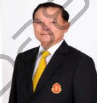
พลเอก วิทวัส รชตะนันทน์ ประธานผู้ตรวจการแผ่นดิน