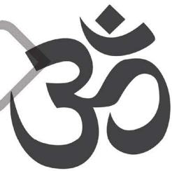
สัญลักษณ์ศาสนาฮินดู