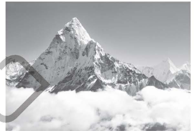
ยอดเขาเอเวอเรสต์