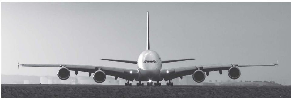
เครื่องบินแอร์บัส A380