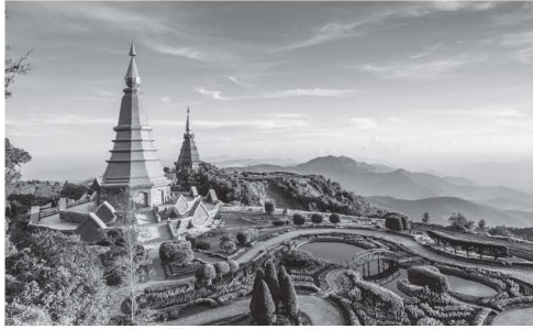
ดอยอินทนนท์ จังหวัดเชียงใหม่