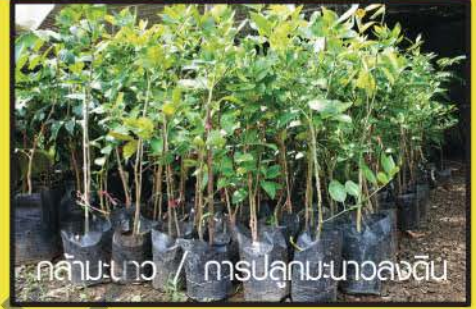
ต้นกล้ามะนาว / การปลูกมะนาวลงดิน