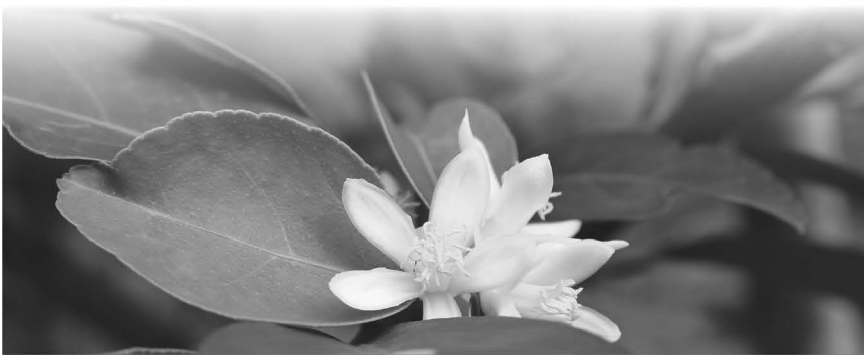
ดอกมะนาวที่มีก้านดอกแข็งแรง

ช่วยบำรุงต้นให้ต้นเจริญเติบโตได้ดี และเสริมก้านดอกให้แข็งแรง ไม่หลุดร่วง ให้ผลผลิตมาก ช่วยเสริมบำรุงดินให้มีธาตุอาหารครบถ้วนอีกด้วย ทั้งนี้ประกอบไปด้วยอาหารหลักของพืช คือ ไนโตรเจน ฟอสฟอรัส และโพแทสเซียม อีกทั้งธาตุอาหารรองที่จำเป็นต่อพืชคือแคลเซียม แมกนีเซียม และสังกะสี