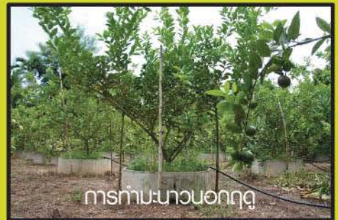
การทำมะนาวนอกฤดู