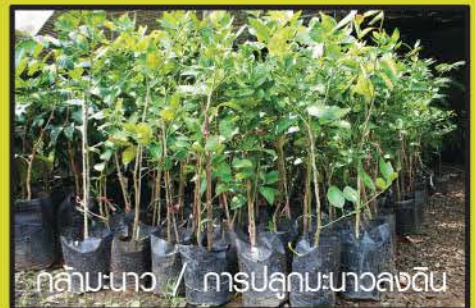
กล้ามะนาว / การปลูกมะนาวลงดิน