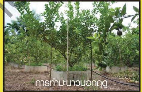
การทำมะนาวนอกฤดู

การปลูกมะนาวนั้น ไม่จำเป็นต้องใช้เงินลงทุนมาก ไม่ต้องใช้เนื้อที่กว้างอย่างพืชชนิดอื่น แม้จะมีเพียงเนื้อที่แคบริมระเบียงก็สามารถสร้างรายได้จากมะนาวได้ อีกทั้งปัจจุบันนี้ไม่ว่าจะเป็นเกษตรกรมือเก่าหรือมือใหม่ก็หันมาปลูกมะนาวมากขึ้น เพราะเป็นพืชที่เก็บผลผลิตได้ตลอดปี ราคาสูง และเป็นที่ต้องการของตลาดรายได้ใหญ่ๆ ไม่ว่าจะเป็นตลาดค้าส่ง ภัตตาคาร ร้านอาหาร โรงแรม หรือแม้แต่ร้านค้าแพรวัวไป