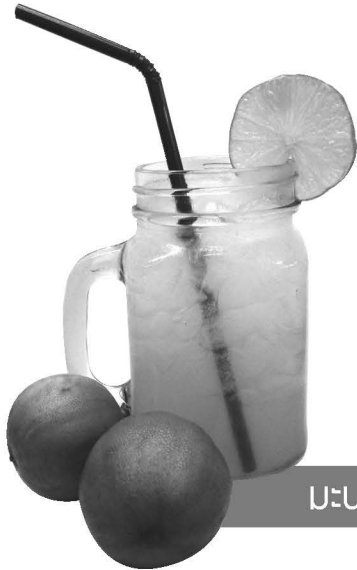
มะนาวโซดา