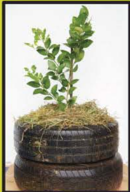
การปลูกมะนาว ในวงล้อยางรถยนต์