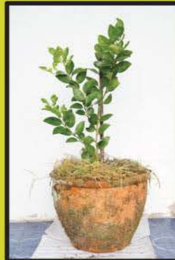
การปลูกมะนาว ในกระถาง