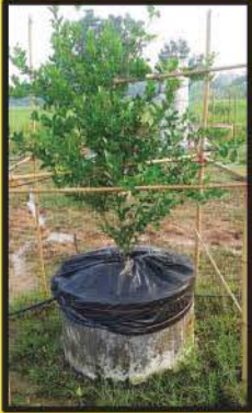
การปลูกมะนาว ในวงบ่อซีเมนต์

รวบรวมขั้นตอนการปลูกมะนาว 5 วิธี พร้อมเทคนิคการเพาะต้นกล้าเพื่อขาย