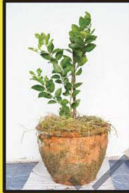
การปลูกมะนาว ในกระถาง