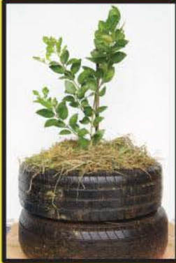
การปลูกมะนาว ในวงล้อยางรถยนต์