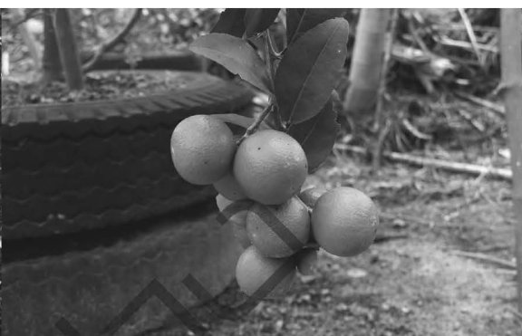
รูปภาพจากสวนมะนาวทอว คุณสรพล กาญจนสมิทธิ