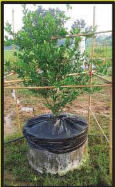
การปลูกมะนาว ในวงบ่อซีเมนต์

เผยเทคนิคการเพาะต้นกล้าเพื่อขาย และขั้นตอนการปลูกมะนาว 5 วิธีแบบมืออาชีพ