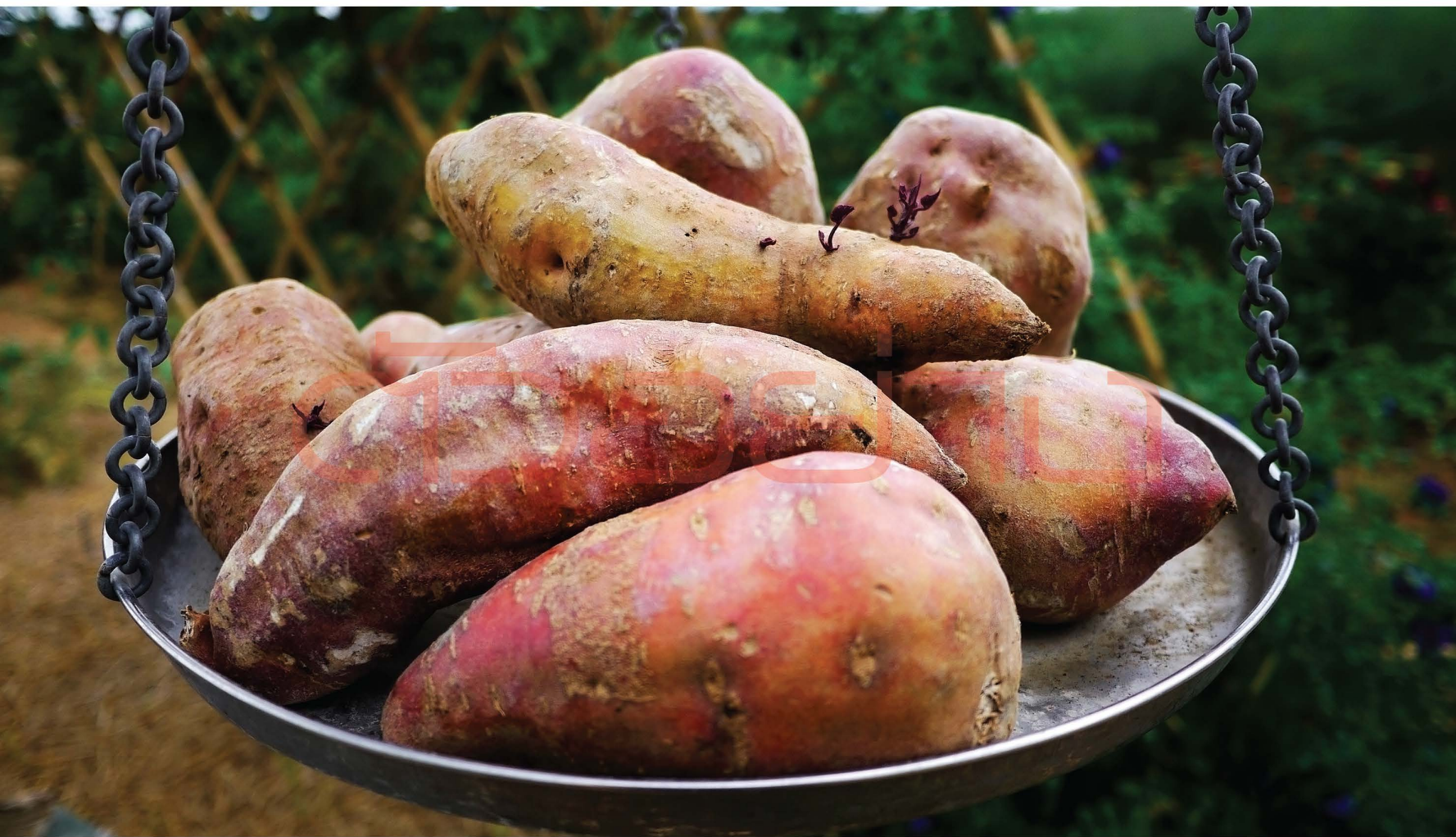
มันเทศญี่ปุ่น ที่มาของซื้อโครงการขั้วมันตามพระราชดำริ