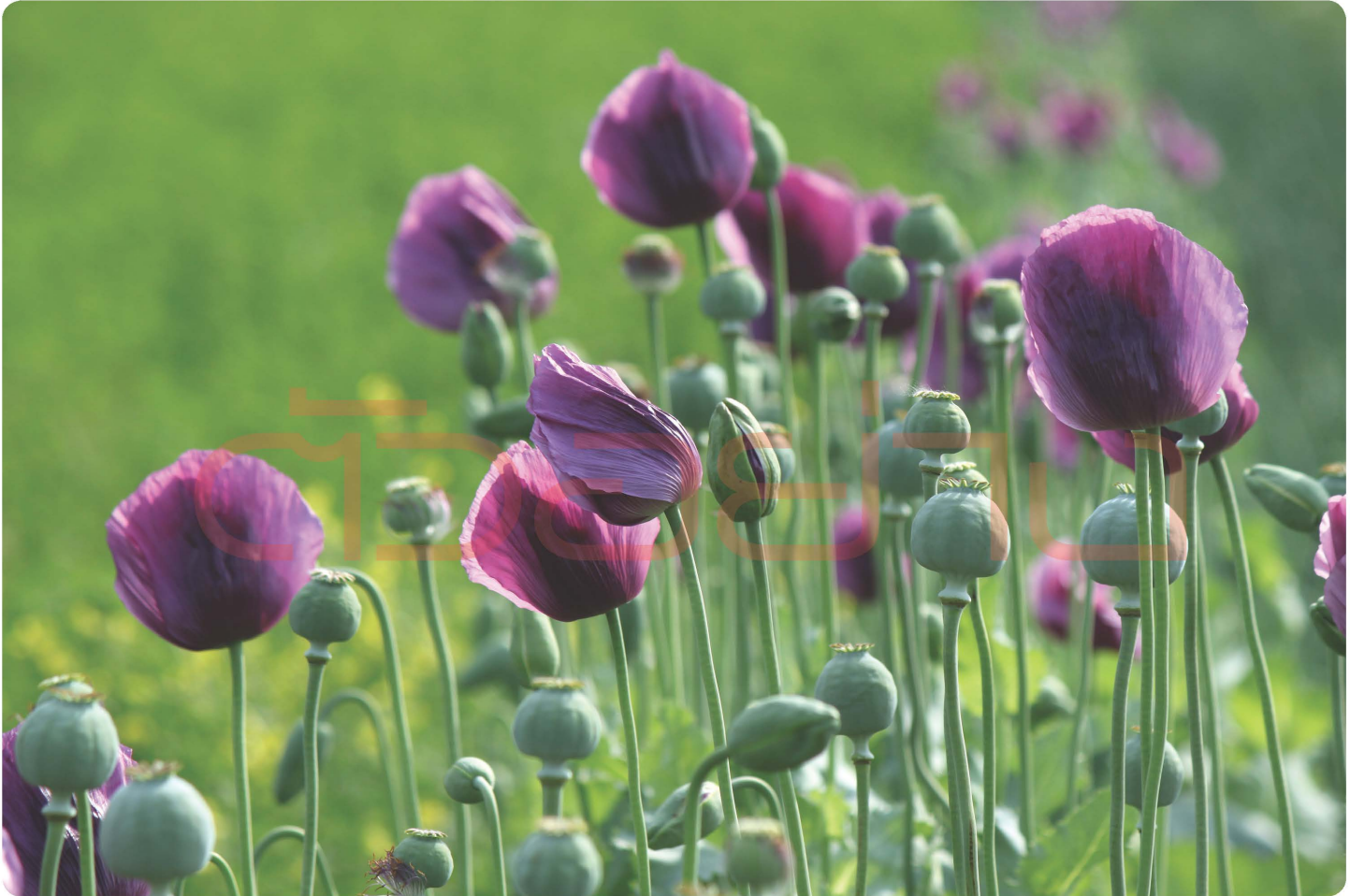
ฝิ่น พืชสวยงามที่แฝงอันตราย ต้นเหตุปัญหายาเสพติดของชาติ