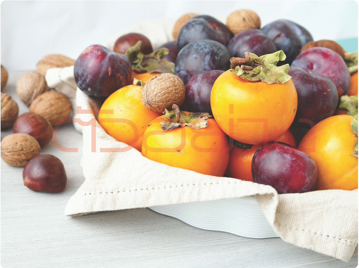
การปลูกไม้ผลยืนต้นทดแทนผืน ช่วยให้ชาวไทยภูเขาเลิกทำไร่เลื่อนลอย เป็นการอนุรักษ์ดินและน้ำอีกทางหนึ่ง