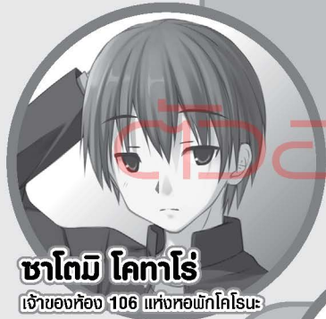
ซาโตมิ โคทาโร่ เจ้าของห้อง 106 แห่งหอพักโคโรนะ