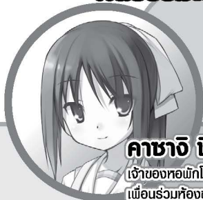
คาซาจิ ชีสึกะ: เจ้าของหอพักโคโรนะและเป็นเพื่อนร่วมห้องของโคทาโร่