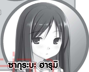
ซากุระบะ: ฮารุมิ เป็นรุ่นพี่ของโคทาโร่ 1 ปีและเป็นประธานสมาคมค้นหาสิ่งตกทอดที่โคทาโร่สังกัดอยู่ ร่างกายอ่อนแอนิดหน่อย