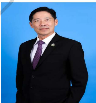
นายแพทย์เรศ กรีษนัยรวังค์ อธิบดีกรมสนับสนุนบริการสุขภาพ

4.2 เสริมสร้างบรรยากาศการเรียนรู้ขององค์กร เพื่อเป็นองค์กรแห่งการเรียนรู้