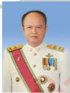
นายทองเปลว กองจันทร์ อธิบดีกรมชลประทาน