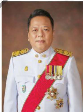
นายธีระพงษ์ วงศ์ทิเววิลาส เลขาธิการคณะรัฐมนตรี