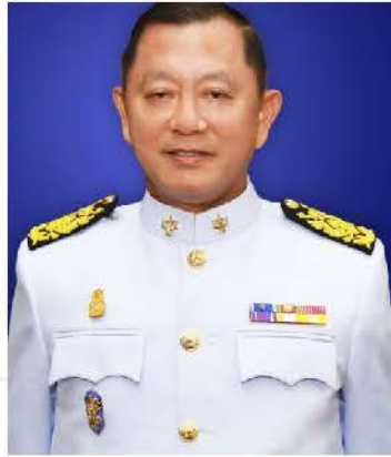
พลเอก ชนะทัฬห อันทามระ ประธานกรรมการตรวจเงินแผ่นดิน