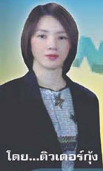
โดย...ตีวเตอร้กุง