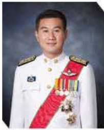
นายสากล ม่วงศิริ

รัฐมนตรีว่าการกระทรวงการพัฒนาสังคมและความมั่นคงของมนุษย์