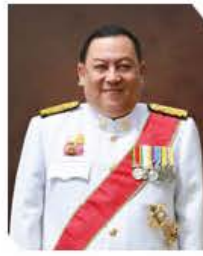
นายจตุติ ไกรฤกษ์

รัฐมนตรีว่าการกระทรวงการพัฒนาสังคมและความมั่นคงของมนุษย์