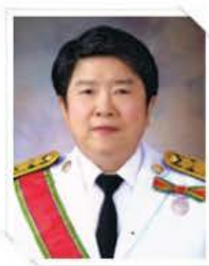
นางสาวอังคณา ใจกิจสุวรรณ รองปลัดกระทรวง