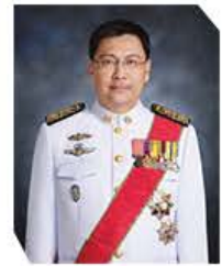
นาวาตรีสุธรรม ระหงษ์

ที่ปรึกษารัฐมนตรีว่าการกระทรวงการพัฒนาสังคมและความมั่นคงของมนุษย์