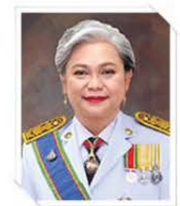
นางสาวแรมรุ่ง วรวิธ รองปลัดกระทรวง