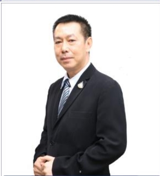
นายกษิพัฒน์ ภูลังกา ร.ก.ผู้เชี่ยวชาญเฉพาะด้านพัฒนาระบบการเรียนการสอน