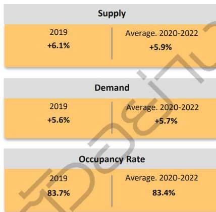
Figure 2: Outlook of Warehouse Market

ดังนั้น ยิ่งตอบสนองความต้องการของลูกค้าได้เร็วเท่าไร ความน่าเชื่อถือ Reliability ยิ่งมีมากขึ้นเท่านั้น การกำหนดการเคลื่อนที่ของสินค้าทุกช่องทางไปถึงจุดแต่ละจุดจึงเป็นสิ่งสำคัญ ตั้งแต่ต้นทางไปจนถึงปลายทางให้ตรงเวลาผลิต ลงคลังสินค้า และกระจายสินค้า เพื่อขนส่งสินค้าไปจนถึงลูกค้า ให้ลูกค้าพึงพอใจมากที่สุดนี่คือเป้าหมายสำคัญของการทำโลจิสติกส์