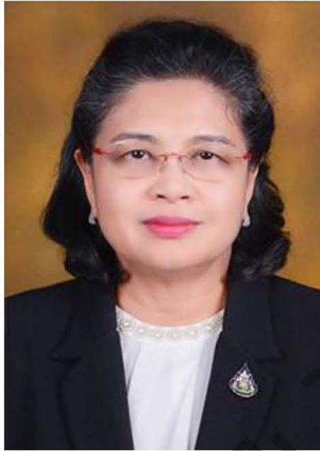
นางอรุณญา ทองน้ำตะโก อธิบดีกรมบังคับคดี