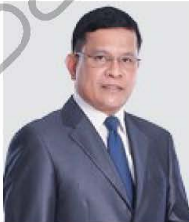
นายประกาศ คงเอียด อธิบดีกรมบัญชีกลาง