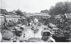
คลองรอบกรุงบริเวณคลอง โอง่าง ตรงตำบลสะพานหิน ภาพถ่ายสมัยรัชกาลที่ ๕