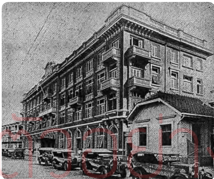
โรงแรมโทรคาเดโร สถานบันเทิงในยามค่ำคึกคักแห่งหนึ่งของคนกรุงเทพฯ