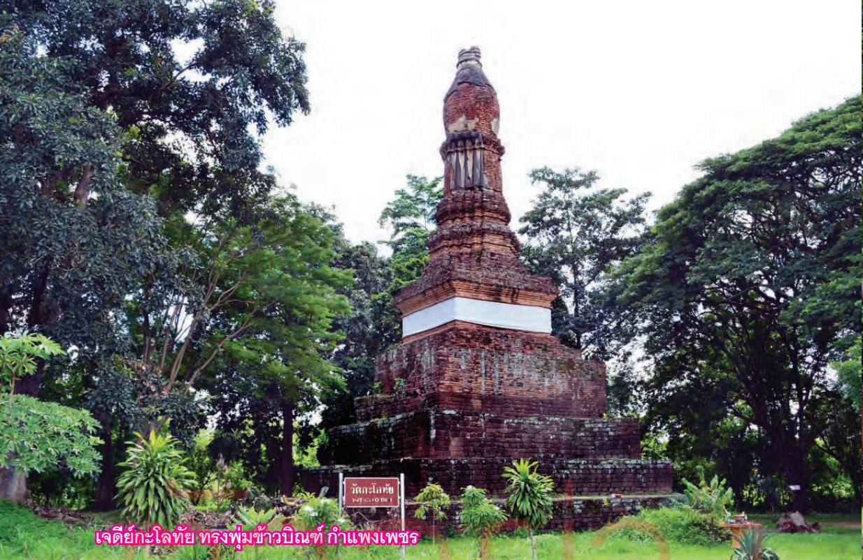
เจดีย์กะโลทัย ทรงพุ่มข้าวบิณฑ์ กำแพงเพชร

ต่อมาภายหลังจึงพิจารณาเห็นว่า ชู เมืองนี้เป็นเมืองเดิมที่เรียกในหนังสือพระราชพงศาวดารว่าเมืองซากังราว ตั้งอยู่ฝั่งตะวันตกได้ปากคลองสวนหมาก เมืองกำแพงเพชรที่ริมน้ำทางฝั่งตะวันออกเป็นเมืองสร้างทีหลัง หลังเมืองกำแพงเพชรออกไปทางตะวันออกที่มีวัดสร้างไว้มากนั้นเป็นที่อรัญญิก มิใช่เมือง