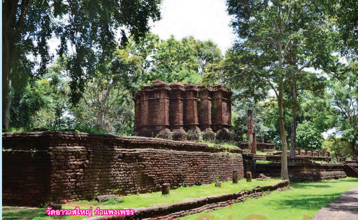
วัดอวาสใหญ่ กำแพงเพชร

ลำน้ำแห่งหนึ่ง ซึ่งได้ความว่าในฤดูแล้งน้ำแห้ง แต่ในฤดูฝนมีน้ำไหล ลำน้ำนี้ปากไปออกแควน้อย ส่วนข้อที่ว่าเมืองเดิมจะตั้งอยู่แห่งใดนั้น ถ้าเมื่อได้ไปดูถึงที่แล้วก็คงจะตอบปัญหาได้ โดยความเชื่อว่าจะไม่พลาดมากนัก คือตามที่ใกล้ๆ ลำน้ำที่กล่าวมาแล้วนั้น มีวัดร้างใหญ่ๆ อยู่ติดๆ กันเป็นหลายวัด ซึ่งพอจะเข้าใจได้ว่าคงจะไม่ได้ไปสร้างไว้นอกเมืองเปล่าๆ และจะต้องเข้าใจอีกอย่างหนึ่งว่า ถึงแม้เมื่อได้ย้ายเมืองลงมาตั้งริมฝั่งแควน้อยแล้ว ก็ยังมีบ้านคนอยู่ในที่ตั้งนครปฐม เพราะยังมีถนนจากประตูสะพานโคมด้านตะวันออกแห่งเมืองกำแพงเพชรออกไปจนถึงวัดต่างๆ ในนครปฐม