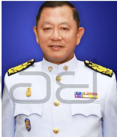
พลเอก ชนะทัฬห อันทามระ ประธานกรรมการตรวจเงินแผ่นดิน