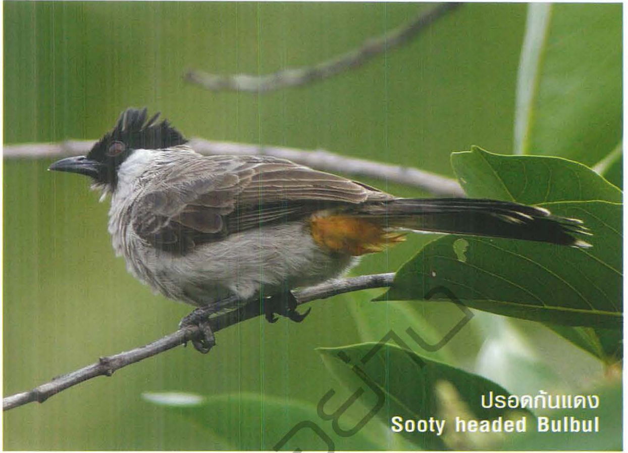
ปรอดก้นแดง Sooty headed Bulbul