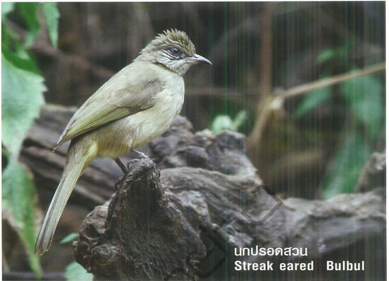
นกปรอดสวน Streak eared Bulbul