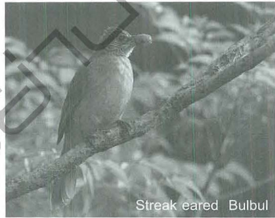
Streak eared Bulbul