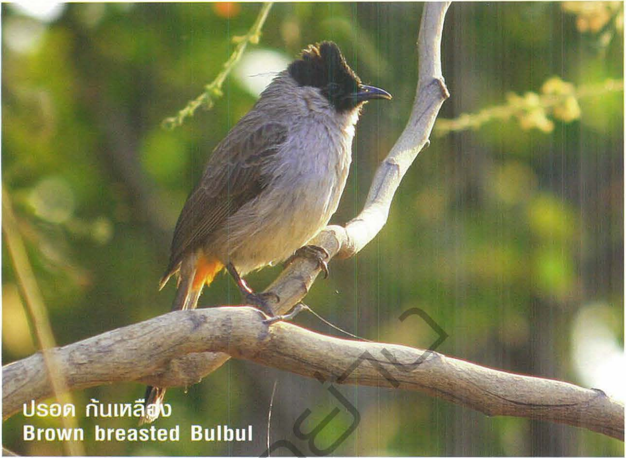
ปรอด กั้นเหลือง Brown breasted Bulbul