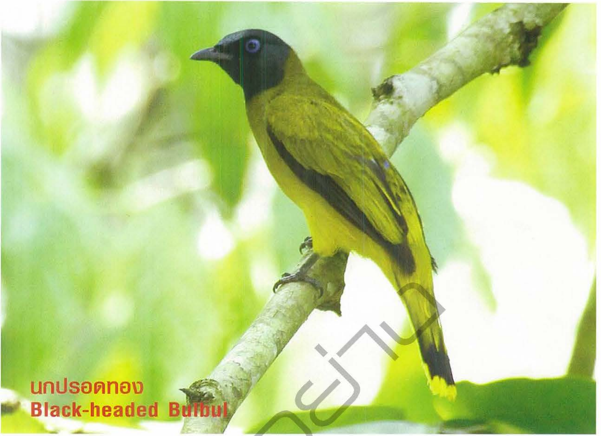
นกปรอดทอง Black-headed Bulbul