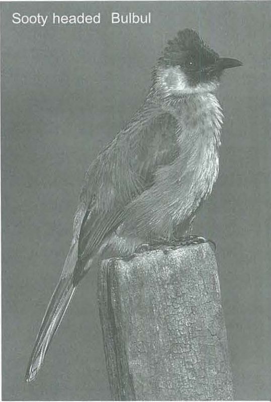
Sooty headed Bulbul