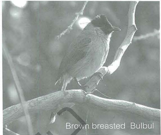
Brown breasted Bulbul

นกชนิดนี้ว่านกกรงหัวจุก ภาคเหนือ เรียกว่า นกปรัดจะหลิว หรือพิซหลิว ส่วนภาคกลาง เรียกว่า นกปรอดหัวจุก หรือนกหรอดหัวโขน