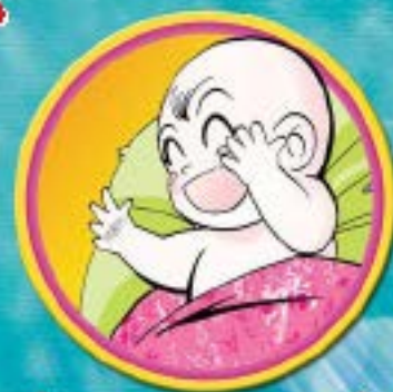
พระบุรพพณาร