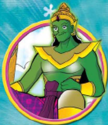
พระอินทร์