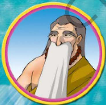
ฤๅษีฤๅษี