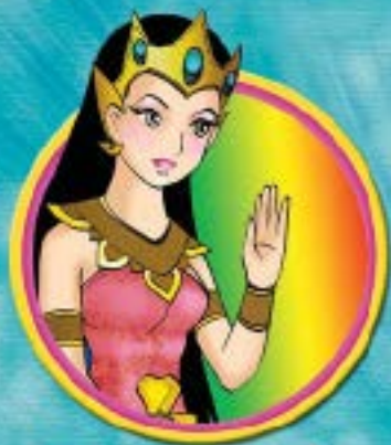
พระอุมาเทวี