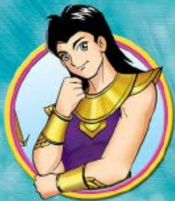
ท้าววิราด