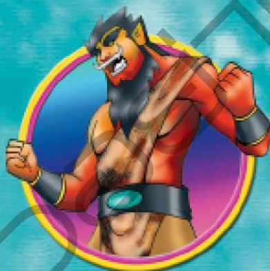
ท้าวพฤตสาร