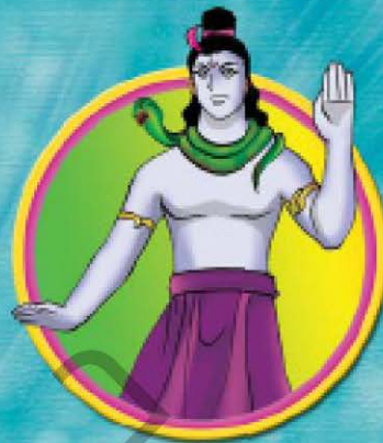
พระอิศวร