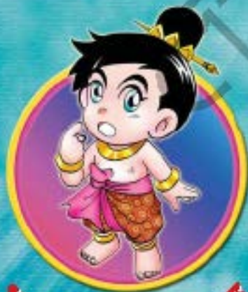
พระสตีปนังกุณาร