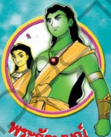
พระลักษมณ์