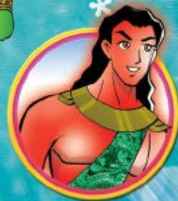
พระบารมี