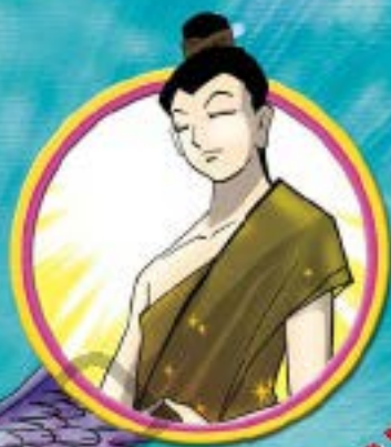
พระพรตบุศ