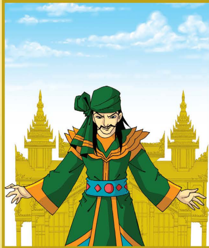
พระเจ้าฝรั่งมังศรีธนะวา