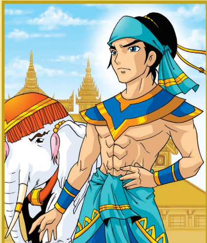
◆ พระเจ้าช้างเผือก (พระเจ้าอยู่) ◆