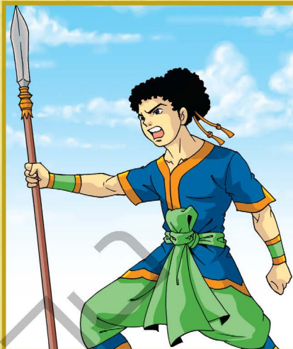
◆ พระเจ้าราชาธิราช (พระยาน้อย) ◆