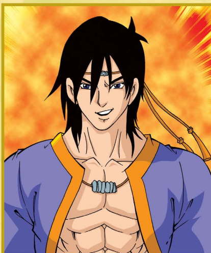
◆ สมิงนครอินทร์ ◆