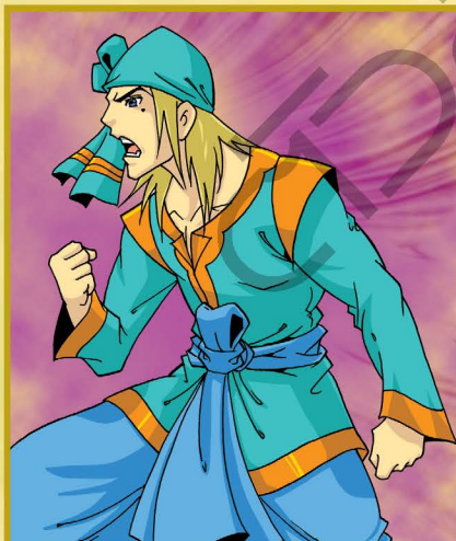
มังรายกะยอฉะวา