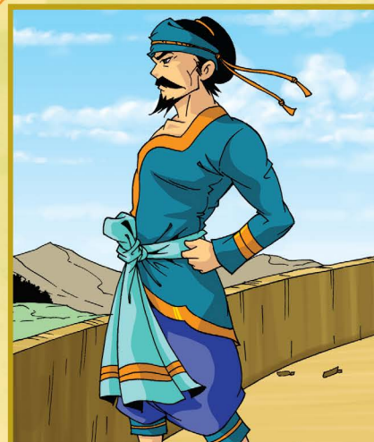
อำมาตย์ทินมณีกรอด