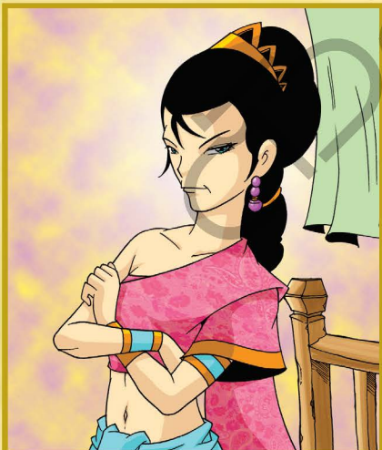
พระมหาเทวี