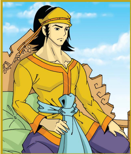
พระยาเกียรติ