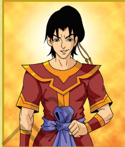
สมิงมราหู