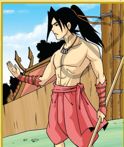
◆ มังกันจี (ราชะมนุ) ◆