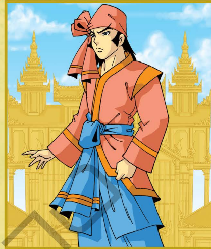
พระเจ้าฝรั่งมังฆ้อง