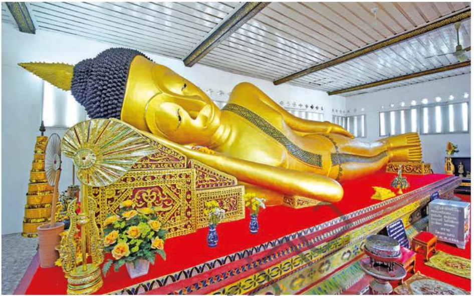
วัดพระนอน

พิพิธภัณฑ์ไม้สัก ตั้งอยู่ในบริเวณศูนย์ฝึกอบรมที่ ๑ ใกล้ศาลหลักเมืองจังหวัดแพร่ โดยใช้อาคารที่ทำการเก่าของบริษัทฮอัสตอเชอียดิก จำกัด จำนวน ๓ หลัง เป็นแหล่งรวบรวมความรู้และประวัติศาสตร์เกี่ยวกับการทำไม้และไม้สัก มีศิลปะ หัตถกรรม สิ่งประดิษฐ์ รูปภาพ ตลอดจนเครื่องมือเครื่องใช้ต่าง ๆ ที่เกี่ยวข้องกับเรื่องไม้สัก เปิดให้เข้าชม วันและเวลาราชการ ติดต่อสอบถามเพิ่มเติมได้ที่ ศูนย์ฝึกอบรมที่ ๑ แพร่ โทร. ๐ ๕๔๕๑ ๑๐๘๘