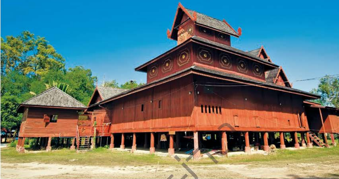
วัดจอมสวรรค์

ลดหลั่นเป็นชั้นประดับประดาลวดลายฉลุ อารามเป็นไม้สัก ใต้เป็นทั้งโบสถ์ วิหาร และกุฏิ ภายในอารามแสดงให้เห็นฝีมือการตกแต่งอย่างวิจิตรบรรจง เพดาน และเสาฉลุไม้ประดับกระจกสีงดงาม โบราณวัตถุภายในวัด ได้แก่ หลวงพ่อसान เป็นพระพุทธรูปที่สร้างโดยใช้ไม้ไผ่สานเป็นองค์รักปิดทอง พระพุทธรูปปางช้าง ซึ่งเป็นศิลปะแบบพม่า คัมภีร์วงช้าง หรือ คัมภีร์ปาติโมกข์ โดยนำงาช้างมาดัดแล้วอัดเป็นแผ่นบาง ๆ เขียนลงรักแดง จารึกเป็นอักษรพม่า และยังมีบุษบก ลวดลายวิจิตรงดงามประดิษฐานพระพุทธรูปหินอ่อน วัดจอมสวรรค์นี้สร้างสมัยรัชกาลที่ ๕ เมื่อ พ.ศ. ๒๔๓๗ โดยชาวเงี้ยว ซึ่งมีถิ่นฐานอยู่ในพม่า และเดินทางมาค้าขายที่เมืองแพร่ เมื่อเกิดเหตุการณ์เงี้ยวปล้นเมืองแพร่ วัดจึงถูกปล่อยให้ทรุดโทรม ต่อมาได้รับการบูรณะจากชาวไทยใหญ่