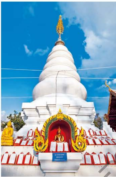
วัดพระธาตุคุดอยเล็ง

วัดพระธาตุคุดอยเล็ง ตำบลช่อแฮ อยู่บนภูเขาสูงทางทิศตะวันออกเฉียงใต้ของพระธาตุช่อแฮระยะทาง ๓ กิโลเมตร ใช้เส้นทางหลวงหมายเลข ๑๐๒๒ เป็นพระธาตุที่ตั้งอยู่สูงที่สุดในบรรดาพระธาตุทั้งหมดในจังหวัดแพร่สามารถมองเห็นทิวทัศน์และภูมิประเทศได้ถึง ๓ อำเภอ คือ อำเภอสูงเม่น อำเภอร้องกวาง อำเภอเมืองแพร่ ซึ่งถือว่าเป็นจุดชมวิวทิวทัศน์ของจังหวัดแพร่อีกจุดหนึ่ง