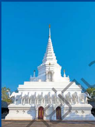
วัดพระธาตุถิ่นหลวง