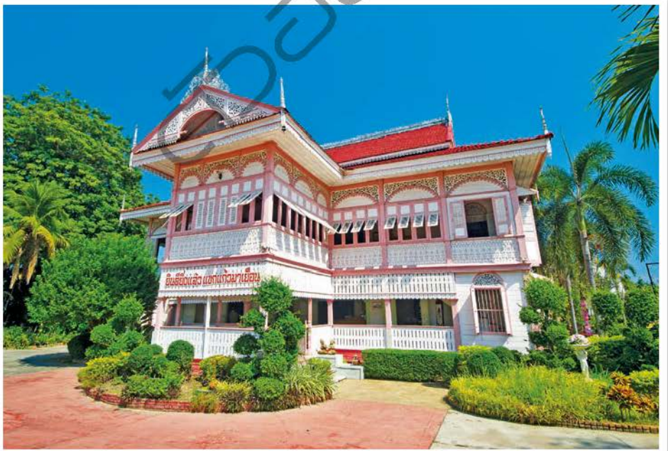
คุ้มวงศ์บุรี

วัดจอมสวรรค์ ถนนยันตรกิจโกศล ตำบลทุ่งกวาว ห่างจากศาลากลางจังหวัด ๑ กิโลเมตร เป็นวัดไทยใหญ่ สร้างแบบสถาปัตยกรรมพม่า หลังคาซ้อน