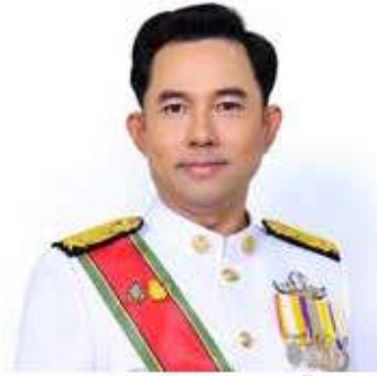
นายอิทธิพล คุณปลื้ม รัฐมนตรีว่าการกระทรวงวัฒนธรรม