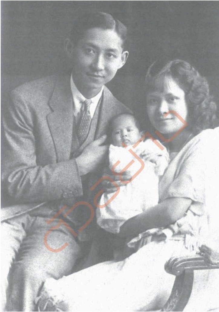
สมเด็จพระมหิตลาธิเบศร อดุลยเดชวิกรม พระบรมราชชนก และสมเด็จพระศรีนครินทราบรมราชชนนี ทรงอุ้มสมเด็จพระเจ้าฟ้ากรมหลวงนราธิวาสราชนครินทร์