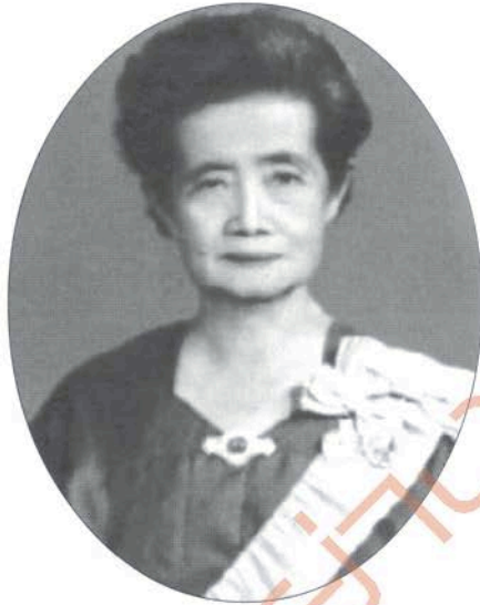
หม่อมเจ้าหญิงอัจฉราฉวี เทวกุล พระธิดาสมเด็จพระยาเทววงศ์วโรปการ