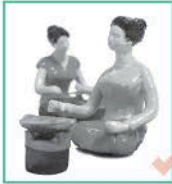
ตุ๊กตาชาววัง