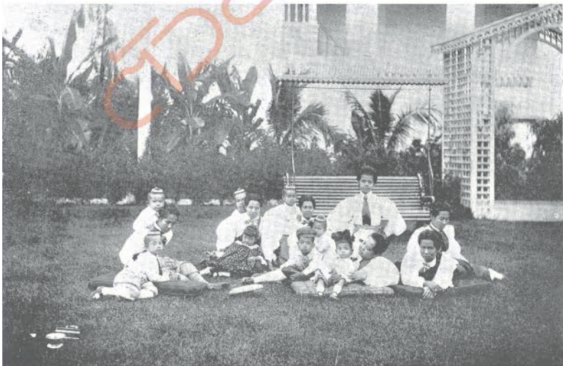
สมเด็จพระศรีพัชรินทราบรมราชินีนาถ ประทับในท่ามกลางพระราชโอรส พระราชธิดา ทรงฉายที่สนามหญ้าสวนศิवालัย ในพระบรมมหาราชวัง