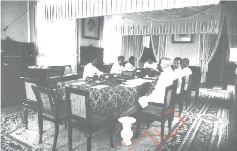
สมเด็จพระศรีพัชรินทราบรมราชินีนาถ เสด็จออก ณ พระที่นั่งราชกรัณยสภา เป็นองค์ประธานในการประชุมปรึกษาราชการแผ่นดิน เมื่อทรงเป็นผู้สำเร็จราชการแผ่นดิน ใน พ.ศ. ๒๔๔๐