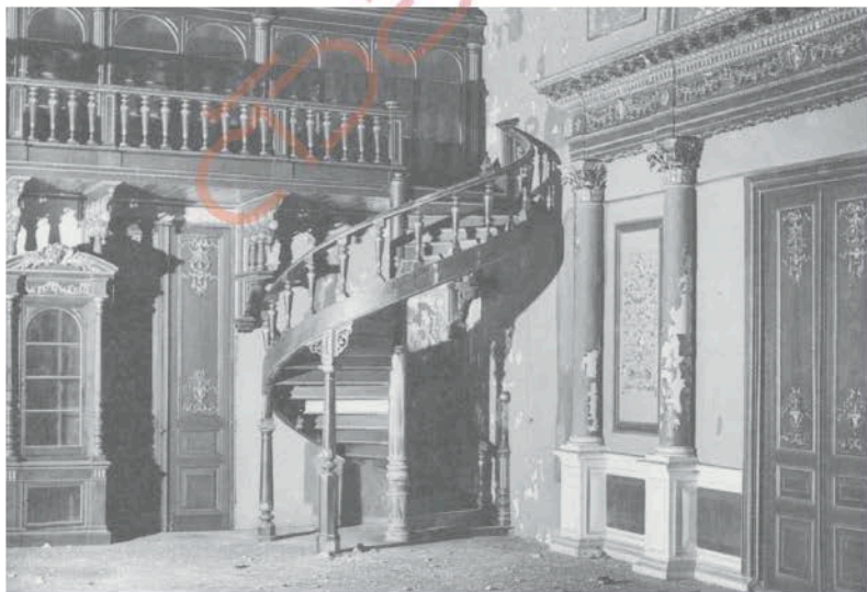
ห้องเขียวหรือพระที่นั่งบรมราชสถิตยมโหฬาร ใช้เป็นห้องเสวยพระกระยาหารมื้อใหญ่ในรัชกาลที่ ๕