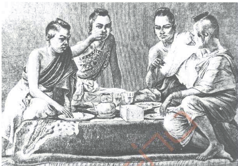
การเปิบข้าวของสาวชาววัง