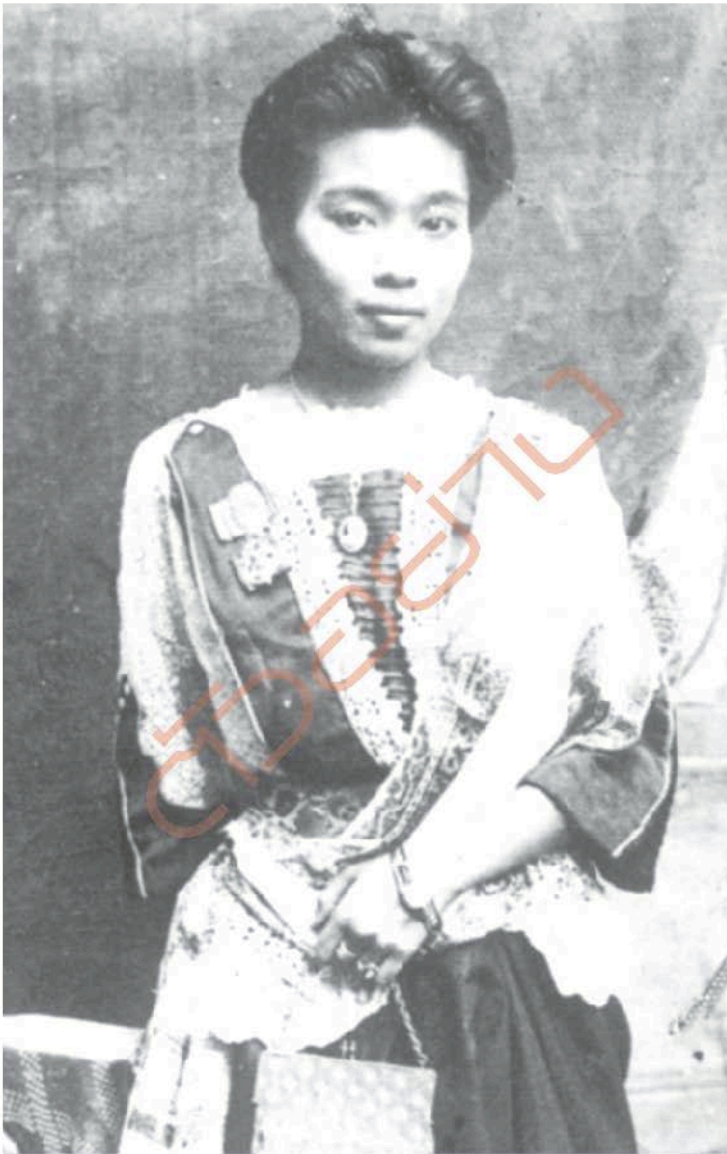
เจ้าจอมหม่อมราชวงศ์สดับ ลดาวัลย์ ผู้ประพันธ์ “น้ำพริกลงเรือ” จนเป็นที่เลื่องลือในหมู่ชาววัง