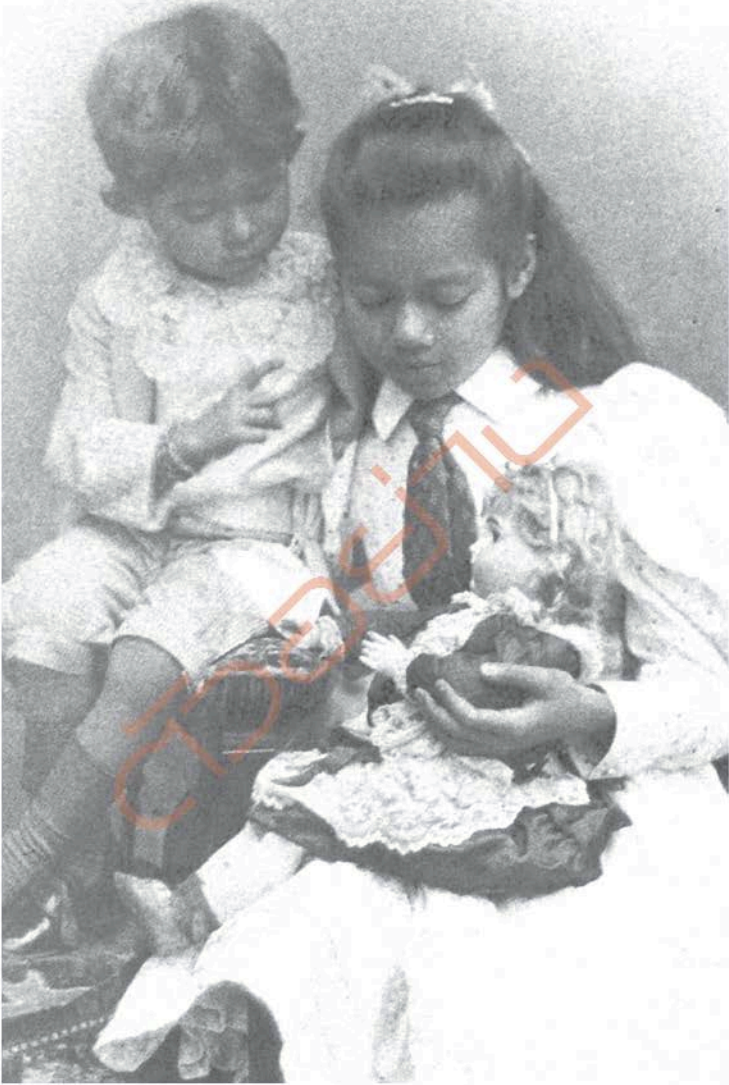
สมเด็จพระเจ้าฟ้ามหิดลอดุลยเดช และสมเด็จพระเจ้าฟ้าวไลยอลงกรณ์