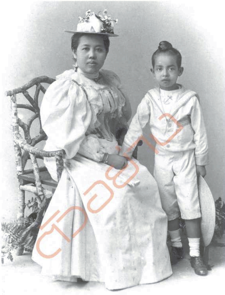
สมเด็จพระศรีพัชรินทราบรมราชินีนาถ ทรงมีวิธีการอบรมสั่งสอนพระราชโอรสธิดาที่เข้มงวด และมีวิธีการทำโทษ ซึ่งเจ้านายเล็กๆ ทุกพระองค์มีพระจริยาวัตรที่ตรงตาม