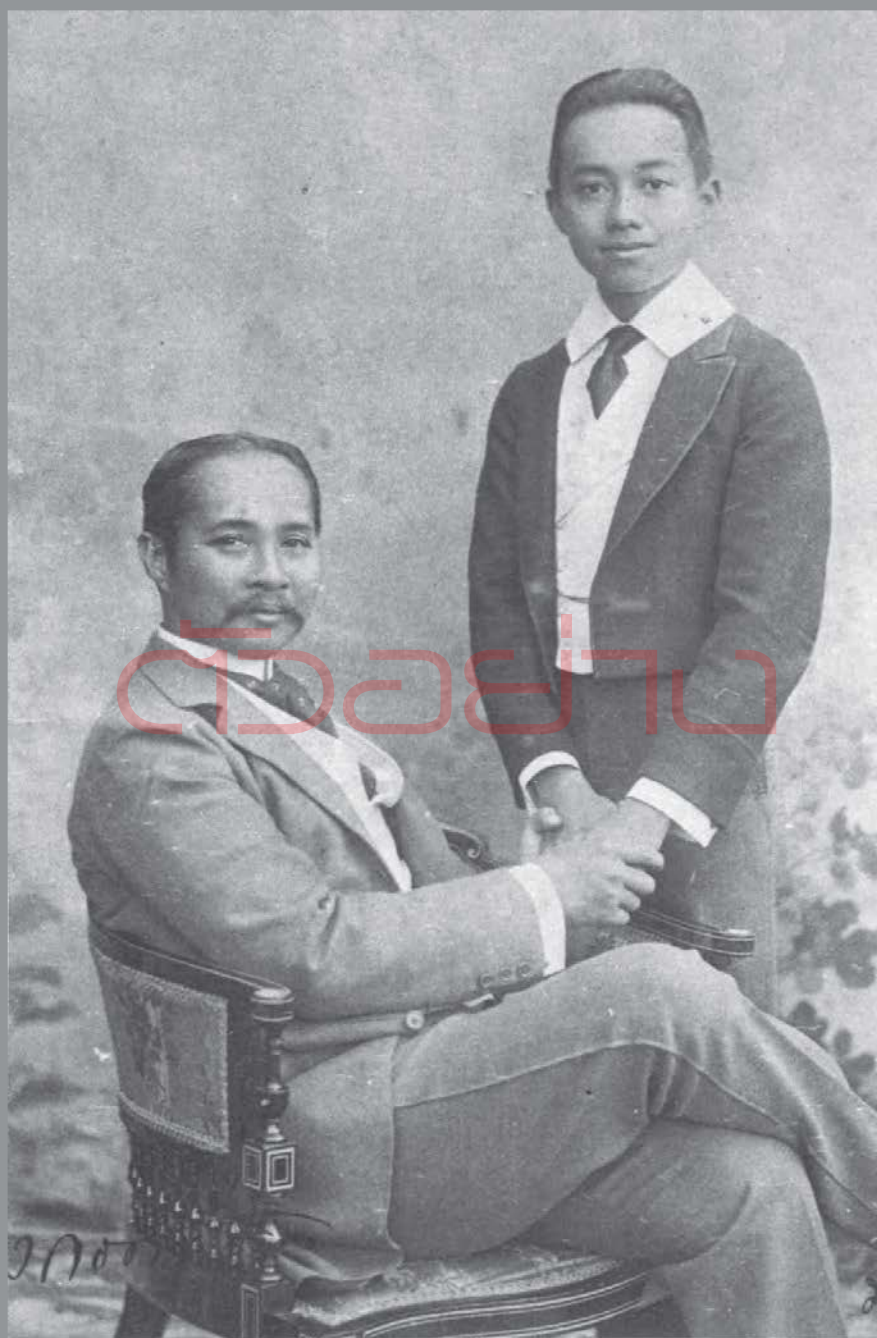
พระบาทสมเด็จพระจุลจอมเกล้าเจ้าอยู่หัวทรงฉายร่วมกับสมเด็จพระบรมโอรสาธิราช เจ้าฟ้ามหาวชิราวุธ