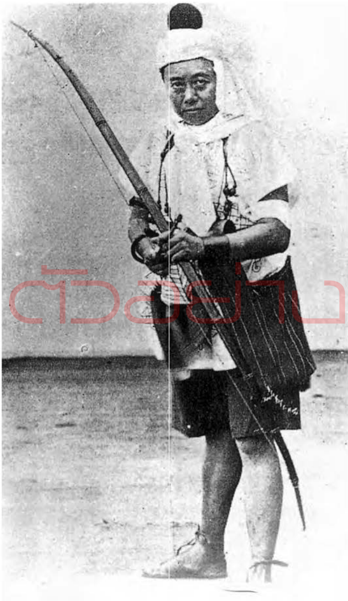
พระบาทสมเด็จพระมงกุฎเกล้าเจ้าอยู่หัวทรงแสดงเป็นนายมัน ปืน ยาว ในละครเรื่องเรื่องพระร่วง เมื่อ พ.ศ. ๒๔๖๗