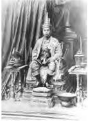
พระบาทสมเด็จพระมงกุฎเกล้าเจ้าอยู่หัว ทรงเครื่องบรมราชกุฎีทากรณ์ ทรงฉาย เมื่อคราวพระราชพิธีพระบรมราชาภิเษก สมโภช พ.ศ. ๒๔๕๔