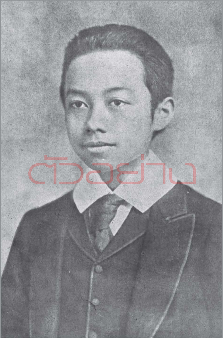
สมเด็จพระเจ้าฟ้าชายมหาวชิราวุธ