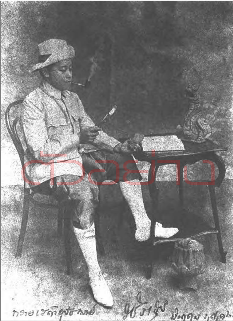
พระบรมฉายาลักษณ์ สมเด็จพระบรมโอรสาธิราชเจ้าฟ้ามหาวชิราวุธ สยามมกุฎราชกุมาร ทรงฉายเมื่อ พ.ศ. ๒๔๕๑