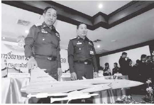
พล.อ.อ.ชลิต พุกผาสุข ผบ.ทอ. แนะนำเครื่องบินกริพเพน

เพน (Gripen) ๓๙ C/D จำนวน ๖ ลำ เป็นเครื่องบิน ๑ ที่นั่ง ๒ ลำ เครื่องบิน ๒ ที่นั่ง ๔ ลำ พร้อมอุปกรณ์ อะไหล่ การฝึกอบรม การปรับปรุงอาคารสถานที่และการบริหารโครงการ เป็นเงิน ๑.๙ หมื่นล้านบาท โดยวิธีรัฐบาลต่อรัฐบาล (จีทูจี) ระหว่างรัฐบาลไทยกับรัฐบาลสวีเดน และเป็น การก่อกำเนิดผูกพันกองทัพอากาศ ในระยะเวลา ๕ ปี ตั้งแต่ปี ๒๕๕๑-๒๕๕๕