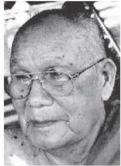
พระครูอดุลยธรรมประสาธน์

หลวงปู่เสรี เป็นพระเกจิดังรูปหนึ่งของภาคอีสาน แต่สร้างวัดถมุงคลไม่มาก ที่มีชื่อเสียงคือ พระกริ่งสีลวาทิม