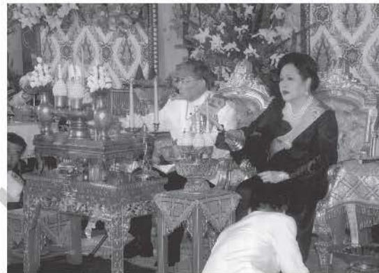
พระบาทสมเด็จพระเจ้าอยู่หัวทรงบำเพ็ญพระราชกุศลทักษิณานุปทาน

ประจวบ ณ โรงพยาบาลศิริราช ตั้งแต่วันที่ ๑๕ มิถุนายน ๒๕๕๐