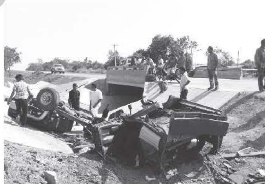
อุบัติเหตุปีใหม่

ส่วนจังหวัดที่เกิดอุบัติเหตุสะสมน้อยที่สุดได้แก่ ภัยโสธร จำนวน ๓ ครั้ง จังหวัดที่ยังไม่มีผู้เสียชีวิต มี ๓ จังหวัด ได้แก่ แม่ฮ่องสอน บัตตานี นราธิวาส