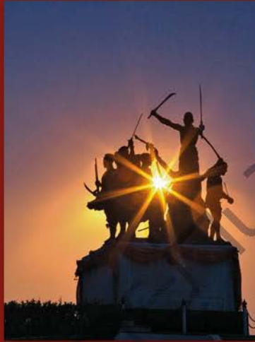
อนุสาวรีย์วีรชนค่ายบางระจันและอุทยานค่ายบางระจัน