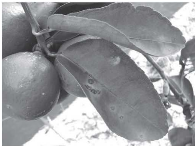
โรคแคงเกอร์