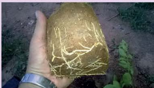
ต้นพันธุ์ที่พร้อมลงปลูก

ได้เต็มร้อย เราจะรอนานไปหน่อย จะทำให้ เราเบื่อหน่ายก่อน เรามาคิดกันเล่นๆ นะครับ ถ้าเปรียบเทียบผลผลิต 4 ปี กิ่งตอนทำลูกได้ 400 ลูกต่อต้น ถ้ามี 100 ต้น เท่ากับ 40000 ลูก ลูกละเฉลี่ย 2 บาท ตกปีละ 80,000 บาท ถ้า 4 ปี เป็นเงิน 320,000 บาท ครับ ส่วนต้น เพาะเมล็ด 3-4 ปี ยังไม่ได้เงินเลยครับ ถ้า ได้ก็ได้น้อยกว่า ต้องมีความอดทนรอสูงหน่อย (สำหรับผม กิ่งตอนดีที่สุดครับ)