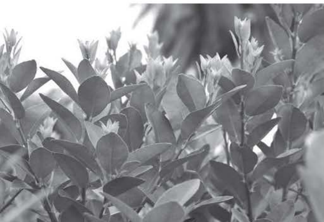
ช่วงแตกใบอ่อน