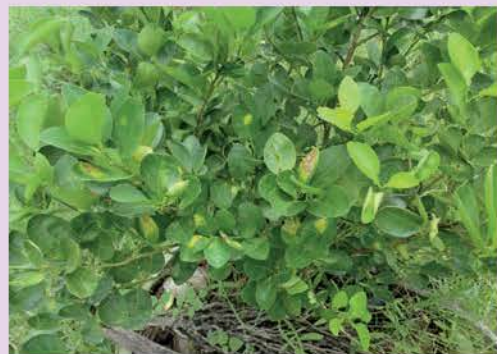
โรคแคงเกอร์

ตอบ : ลงดินจะอายุยาวกว่า 10-20 กว่าปี เลยทีเดียว และต้นสมบูรณ์ยาวกว่า ส่วนลง บ่อประมาณ 4-5 ปี ต้นก็จะโทรม ถ้าใช้บ่อ ใหญ่ขึ้น 100-120 เมตร 7-9 ปี ต้นจะโทรม แต่การปลูกลงบ่อไม่ต้องกังวลใจไป เพราะถ้า ต้นโทรมเราก็รื้อแล้วก็ปลูกใหม่แค่ปีเดียวต้นก็ โตเก็บลูกขายได้ต่อครับ