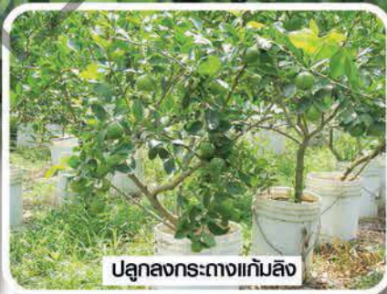
ปลูกลงกระถางแกมลิ่ง