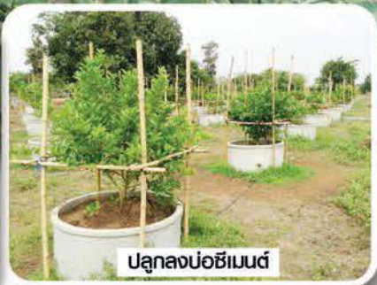
ปลูกลงบ่อซีเมนต์