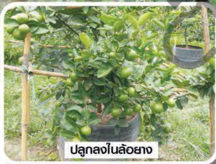
ปลูกลงในล้อยาง