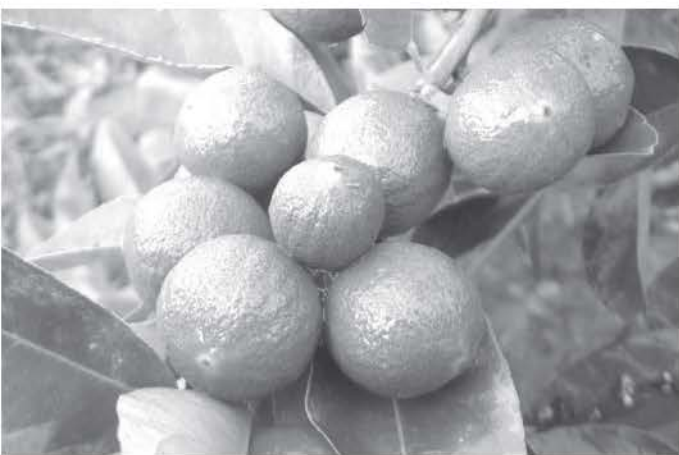
สวนมะนาวแป้นท้ายไร่

เป็นไม้ยืนต้นขนาดกลางความสูงต้นอาจสูงถึง 3 เมตร ขนาดทรงพุ่ม 2-3 เมตร แตกกิ่งก้านสาขาไม่เป็นระเบียบ มีหนามเล็ก ลึน แต่ปริมาณไม่มาก ใบสีเขียวเข้ม รูปใบรีออกยาว มีขนาดกว้าง 3.5-4.5 เซนติเมตร ยาว 8-10 เซนติเมตร ก้านใบยาว 0.7-1.0 เซนติเมตร เส้นกลางใบสีเขียวอ่อน ขอบใบหยักเล็กน้อย ใบไม่มีหู ดอกสีขาวอมม่วงอ่อน มีกลีบดอก 5 กลีบ เกสรตัวผู้สีเหลือง ดอกออกเป็นกลุ่ม 5-10 ดอก บริเวณกิ่งใหม่ที่แยกจากกิ่งอายุมาก ผลเมื่ออ่อนสีเขียวแก่จัดสีเหลือง ผิวผลไม่เรียบ มีคลื่นเล็กน้อย เปลือกหนา 0.3 เซนติเมตร เส้นผ่านศูนย์กลาง