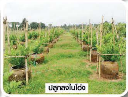
ปลูกลงในโอ่ง