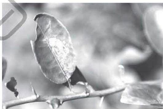
หนอนซอนใบ