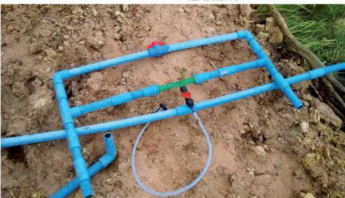
การวางระบบน้ำ

น้ำมาก มีเมล็ดน้อย และปลูกง่าย ดูแลง่าย ด้านทานโรคได้ดี แม่ค้าตามร้านอาหารร้านส้มตำ ย่านจังหวัดสุรินทร์ปลื้มมากๆ นอกจากมะนาว ไข่แล้วที่สวนมะนาวชายทุ่งยังปลูกเป็นพืชจิตร 1 เป็นพวง ตาฮิติ เป็นดอกไม้พิเศษอีกด้วย