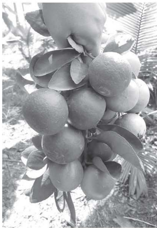
มะนาวพันธุ์แป้นพวง

3. พันธุ์ตาฮิติ เป็นพันธุ์มะนาวจากหมู่เกาะตาฮิติ นำมาปลูกทดลองในประเทศไทย ในปัจจุบันมีการปลูกแพร่หลายในเขตพื้นที่ภาค