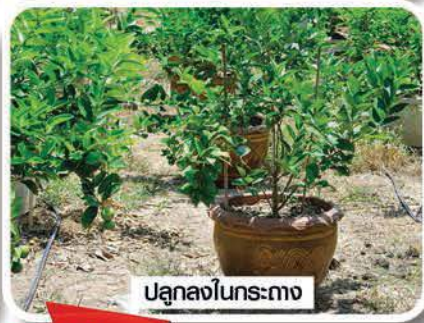
ปลูกลงในกระถาง