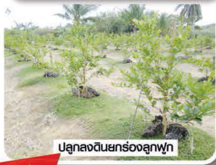
ปลูกลงดินยกร่องลुकฟัก