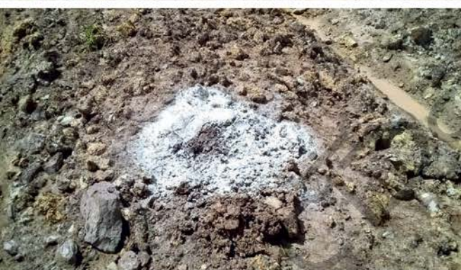
ปรับสภาพดิน

20-50 เซนติเมตร บนสันร่องกว้าง 1 เมตร ร่องทางเดินด้านข้าง 3 เมตร ที่ยกร่องก็เพื่อไม่ให้รากมะนาวถูกน้ำท่วมขัง