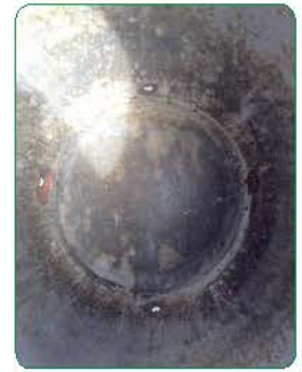
เจาะรูใต้โอ่ง 4 จุด โดยใช้คอรื้งเจาะ

ให้เข้ากัน โดยจะใช้วัสดุปลูกในอัตรา ดิน 1 ส่วน ใบไม้ผุ 2 ส่วน และปุ๋ยคอก 1 ส่วน เมื่อผสมวัสดุปลูกให้เข้ากันแล้ว จากนั้นให้นำไปเทใส่ในโอ่งที่เตรียมไว้ให้สูง 2 ใน 3 ส่วน แล้วจึงลงมือนำกิ่งพันธุ์มะนาวมาปลูก”