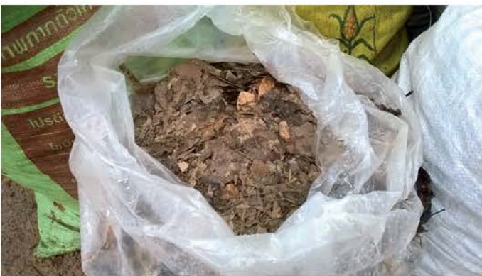
ใบไม้แห้ง