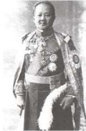
สมเด็จพระเจ้าบรมวงศ์เธอ กรมพระยาเทวะวงศ์วโรปการฯ เสนาบดีกระทรวงการต่างประเทศ 12 มิถุนายน พ.ศ. 2428 - 28 มิถุนายน พ.ศ. 2466

ถึงแม้ว่ากรมพระคลังมหาสมบัติจะได้แยกออกไปจากกรมท่า และมีได้อู่ภายใต้เสนาบดีจตุสดมภ์กรมท่า ตั้งแต่ปี พ.ศ. 2418 แล้วก็ตาม แต่กรมท่าก็ยังคงมีส่วนราชการซึ่งไม่มีหน้าที่เกี่ยวข้องกับกระทรวงการต่าง ประเทศ หัวเมืองขึ้นและศาลอยู่ในสังกัดอีกจำนวนหนึ่ง