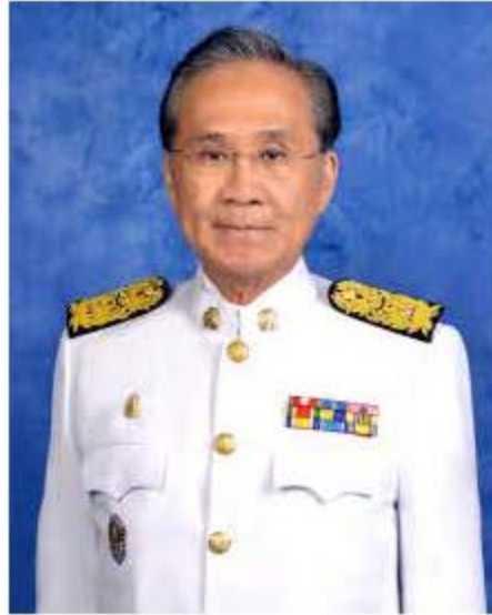
นายคอง ปรมัตต์วินัย รัฐมนตรีว่าการกระทรวงการต่างประเทศ