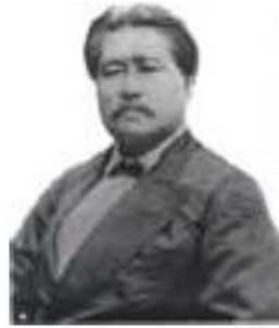
เจ้าพระยาภาณุวงศ์มหาโกษาธิบดีเสนาบดีกระทรวงการต่างประเทศคนแรก ระหว่างปี 2418-2428