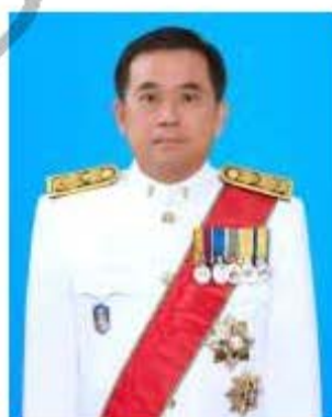
ศาสตราจารย์พิเศษวิศิษฏ์ วิศิษฏ์สรอรรถ