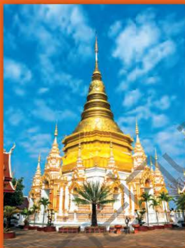
วัดพระพนมบาททากหน้า