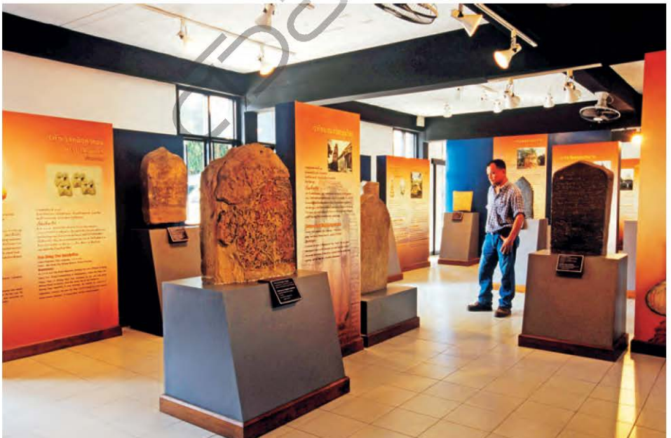
พิพิธภัณฑ์สถานแห่งชาติหริภุชชัย

ขุมประตู่ ก่อนเข้าไปในบริเวณวัดจะผ่านขุมประตู่ฝีมือโบราณสมัยศรีวิชัยก่ออิฐถือปูนประดับลวดลายวิจิตรพิสดาร ประกอบด้วย ขุมยอดเป็นชั้น ๆ หน้าขุม