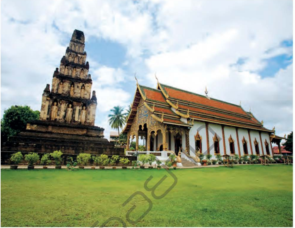
วัดจามเทวี

หมู่บ้านหัตถกรรมผ้าฝ้ายเวียงยองและข้าวmungท่า สิงห์ อยู่บ้านศรีเมืองอยู่ ตำบลเวียงยอง ตรงข้าม วัดพระธาตุดุริฎกษัยวรมหาวิหาร ชมวิถีชีวิตชาว บ้านในเส้นทางถนนสายวัฒนธรรมชุมชนเวียงยอง เป็นหมู่บ้านผลิตผ้าฝ้ายและผ้าไหมยกดอก ภายใน หมู่บ้านยังมีสถานที่ท่องเที่ยวที่น่าสนใจ เช่น วัดต้น แก้ว พิพิธภัณฑ์พื้นบ้าน ศูนย์ทอผ้าพื้นเมือง เป็นต้น มีเส้นทางที่เหมาะสมแก่การเดินเท้าหรือนั่งรถสามล้อถีบ ติดกับหมู่บ้านเวียงยองยังมี ข้าวmung ท่าสิงห์ ตลาด จำหน่ายผลิตภัณฑ์โอท็อป เช่น ผ้าฝ้ายยกดอกลำพูน สินค้าตกแต่งบ้าน เครื่องประดับ เป็นต้น เปิดทุกวัน ตั้งแต่เวลา ๐๙.๐๐-๑๘.๐๐ น.