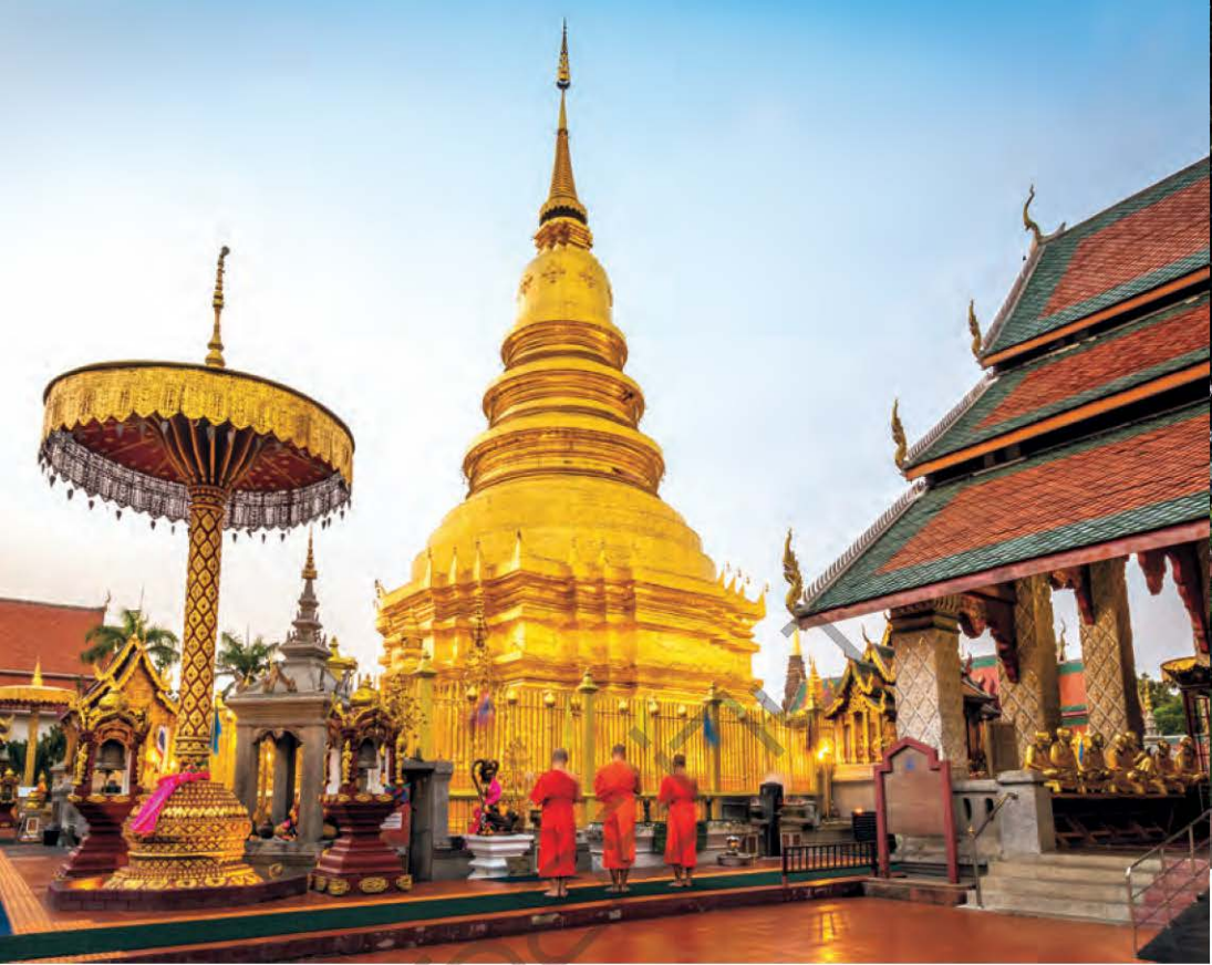
วัดพระธาตุทริภุญชัยรวมหาวิหาร

ประตุมีรูปสิงห์ ๑ คู่ ยืนบนแท่นสูง ๑ เมตร สร้างขึ้นในสมัยพระเจ้าอาทิตย์ราชเมือทรงถวายวังให้เป็นสังฆาราม