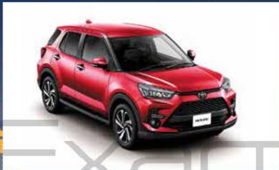
28 พลัดลอนทางแคบ TOYOTA RAIZE