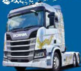
• แกรงลองรถไฟ SCANIA YAK EDITION