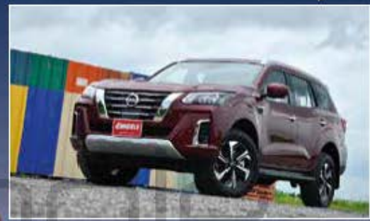
30 ทดลองขับ NISSAN TERRA ใหม่