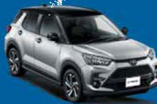
• พลางลองรถไฟ TOYOTA RAIZE