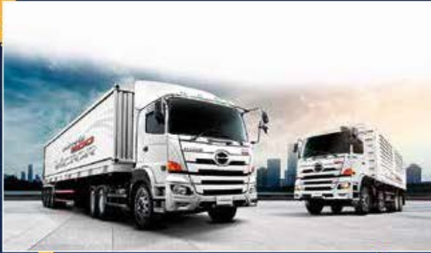
24 เครื่องยนต์ใหม่ HINO 500 VICTOR MY21