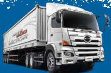
• แกรงลองรถไฟ HINO 500 VICTOR MY21