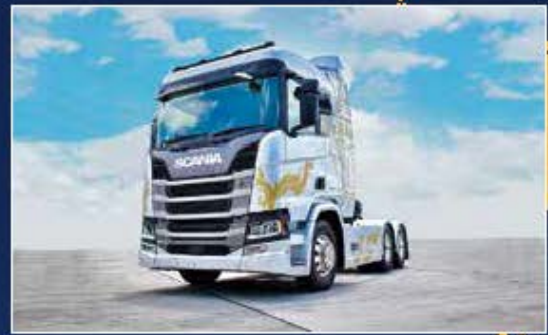
26 เครื่องยนต์ใหม่ SCANIA YAK EDITION