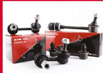
ลูกหมากกันโคลง