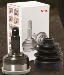
NTR หัวเพลาขับเคลื่อน สำหรับรถเก๋งและปิคอัพ 4x4