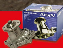
AISIN ปั๊มน้ำ สำหรับรถเก๋งและปิคอัพทุกรุ่น