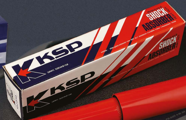
KSP ใช้ค้อสำหรับ ปิคอัพทุกรุ่น