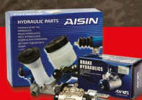
ชุดซ่อมคัลชปั๊มน้ำ-อ่าง AISIN ปั๊มน้ำเบรกรถ สำหรับรถเก๋งและปิคอัพทุกรุ่น