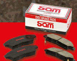
ชุดซ่อมคัลชปั๊มน้ำ-อ่าง SAM อ่างเบรกรถ สำหรับรถเก๋งและปิคอัพทุกรุ่น

เรา K.S.V พร้อมรับใช้ เพื่อให้รถของคุณอยู่ในสภาพสมบูรณ์