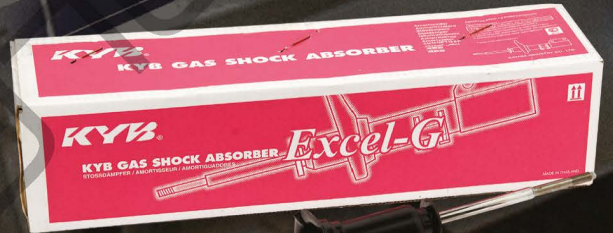
KYB ใช้ค้อแก๊สสำหรับรถเก๋ง และปิคอัพทุกรุ่น

ที่ต้องการการขับขี่ที่มั่นคงและนุ่มนวล ให้ได้อย่างแท้จริง ใช้ค้อ KSP สามารถตอบสนองความนุ่มนวล การยึดเกาะถนน เข้าโค้งได้อย่างมั่นใจ เมื่อใช้ผลิตภัณฑ์ ใช้ค้อ KSP แล้วคุณจะไม่พบกับคำว่า "ผิดหวัง"