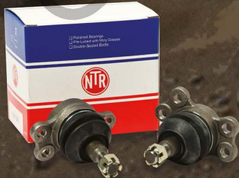
NTR ลูกหมากคุณภาพ สำหรับรถเก๋งและปิคอัพทุกรุ่น