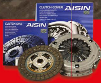
AISIN ชุดคัลชคุณภาพ สำหรับรถเก๋งและปิคอัพทุกรุ่น