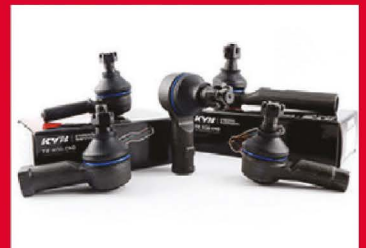
ลูกหมากคั่นชัก