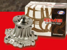
GMB ปั๊มน้ำ สำหรับรถเก๋งและปิคอัพทุกรุ่น