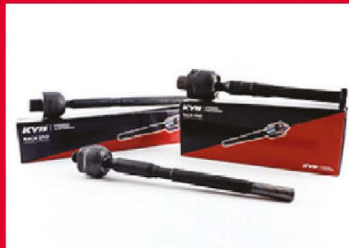
ลูกหมากแฉีก