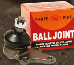
THREE 555 FIVE ลูกหมากคุณภาพ สำหรับรถเก๋งและปิคอัพทุกรุ่น