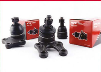
ลูกหมากปีกนก

ลูกหมากรถยนต์ ทนกว่า อึดกว่า มาตรฐานโรงงาน ผลิตรถยนต์