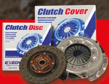
EXEDY ชุดคัลชคุณภาพ สำหรับรถเก๋งและปิคอัพทุกรุ่น