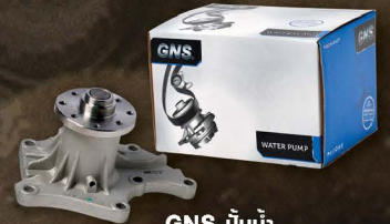
GNS ปั๊มน้ำ สำหรับรถปิคอัพทุกรุ่น