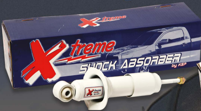
Xtreme ใช้ค้อสำหรับรถปิคอัพทุกรุ่น