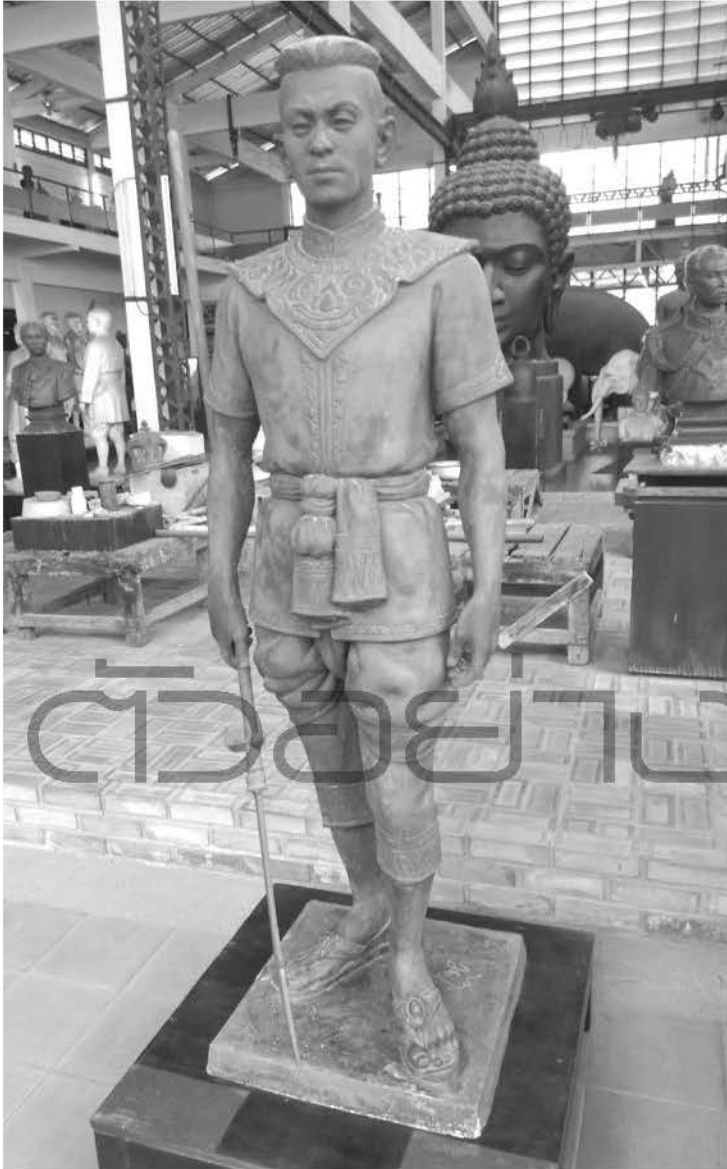
พระบรมรูปหล่อสมเด็จพระเอกาทศรถ ในหอประติมากรรมต้นแบบ กรมศิลปากร