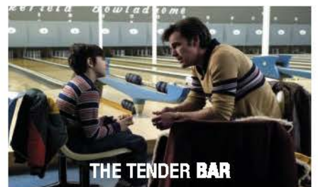
THE TENDER BAR

หนังที่ดัดแปลงจากวรรณกรรมเอกของ William Shakespeare เล่าด้วยภาพขาวดำ กำกับโดยเจ้าของรางวัลจาก No Country for Old Men และนำแสดงโดย 2 คารา เจ้าของรางวัลออสการ์ Denzel Washington และ Frances McDormand เอ้ยเพียงแค่นี้ก็ขึ้นแท่นเป็นหนัง Must see แห่งปีของคอหนังดีไปเรียบร้อยแล้ว หนังเปิดฉายรอบปฐมทัศน์ ในเทศกาลภาพยนตร์นิวยอร์ก แล้วก็กวาดคำชมไปถึง 98 เปอร์เซ็นต์ หากคุณชื่นชอบงานศิลปะชั้นเลิศ ปีคือ ผลงานที่ต้องพิสูจน์ด้วยตาของคุณเอง