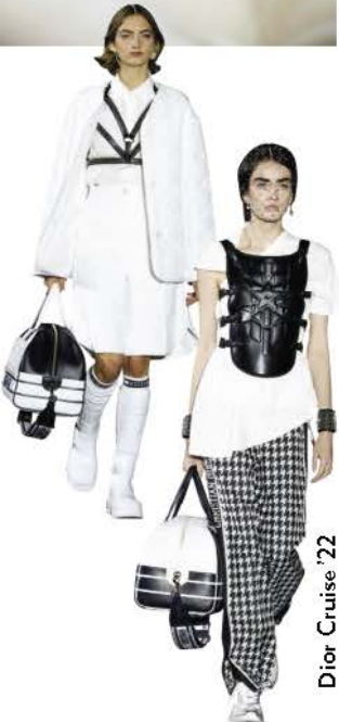
Dior Cruise '22

หยิบใช้บ่อยๆ รวมไปถึงลวดลายโลโก้ "Christian Dior" ชวนให้นึกถึงความสำเร็จของกระเป๋า Dior Book Tote อีกหนึ่งงานออกแบบชิ้นไอคอนของเธอ