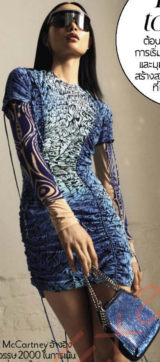
Stella McCartney อ้างอิงถึงทศวรรษ 2000 ในการฟื้นแนวคิดเกี่ยวกับไซเบอร์พังก์ของคอลเล็กชันฤดูใบไม้ผลิ 2022

Back to LIFE ต้อนรับบรรยากาศแห่งการเริ่มต้น ความเคลื่อนไหว และมุมมองสดใหม่ในการสร้างสรรค์ของแต่ละแบรนด์ที่ไม่เคยทำมาก่อน