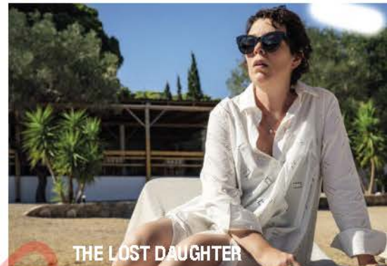
THE LOST DAUGHTER

หนังตัวเต็งจากทุกเวทีรางวัล ที่ดูได้พร้อมกันที่บ้าน