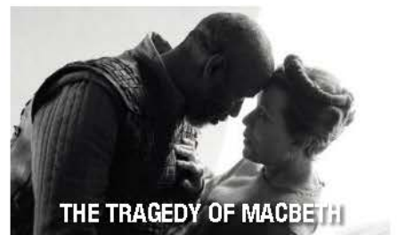
THE TRAGEDY OF MACBETH

ภาพยนตร์ดราม่าผลงานการกำกับหนึ่งเรื่องแรกของ Maggie Gyllenhaal เล่าถึงหญิงวัยกลางคนที่หมกมุ่นกับ คุมแม่ลูกที่เธอพบขณะไปพักผ่อนที่หาดส่วนตัว เพราะมัน ไปกระตุ้นความทรงจำเกี่ยวกับลูกๆ ของเธอในอดีต หนึ่ง ได้รับคำชมอย่างล้นหลามโดยเฉพาะการแสดงของ Olivia Colman แห่ง The Crown และ Dakota Johnson จาก Fifty Shades of Grey ตัวหนังได้รับรางวัลบทภาพยนตร์ ยอดเยี่ยมมาจากเทศกาลภาพยนตร์เวนิส นอกจากนี้ กำกับแล้ว แม็กก็ยังมีเขียนบทหนังเรื่องหนึ่งเอง แกมสามมี Peter Sarsgaard ก็ร่วมแสดงด้วย