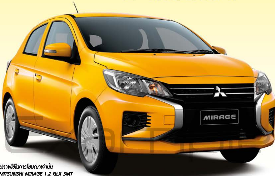
รูปภาพใช้ในการโฆษณาเท่านั้น *MITSUBISHI MIRAGE 1.2 GLX 5MT

เพียงนำไปแสดงการซื้อสินค้าจากร้านค้าที่ร่วมรายการ (ยกเว้นการจองซื้อรถยนต์ใหม่ รถจักรยานยนต์ และรถยนต์ใช้แล้ว) ในงาน "มหกรรมยานยนต์ ครั้งที่ 38" หรือ MOTOR EXPO 2021 ภายในวันเดียวกัน ตั้งแต่ 2,000 บาทขึ้นไป มาลงทะเบียน ณ จุดกิจกรรมภายในบริเวณงาน