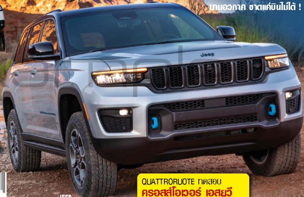
JEEP GRAND CHEROKEE