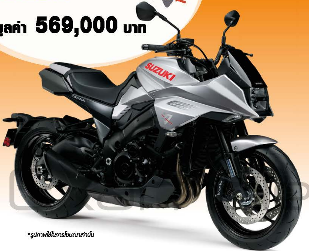
*รูปภาพใช้ในกรณีโฆษณาเท่านั้น

เพียงจองและ/หรือซื้อรถมอเตอร์ไซค์ไฟฟ้ายางแบน “มหกรรมยานยนต์ ครั้งที่ 38” นอกจากจะได้รับข้อเสนอสุดพิเศษจากผู้จำหน่ายแล้ว ยังมีโอกาสชิงรางวัลรถมอเตอร์ไซค์ SUZUKI BIG BIKE รุ่น KATANA มูลค่า 569,000 บาท ในรายการ “ซื้อมอเตอร์ไซค์ ชิงบิกไบค์” อีกด้วย