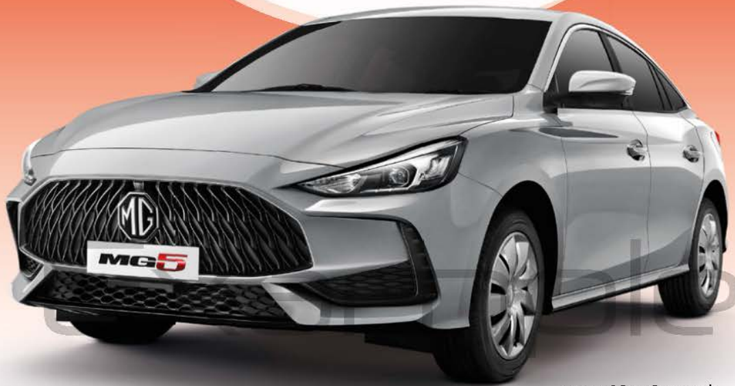
*รูปภาพใช้ในการโฆษณาเท่านั้น

เพียงซื้อบัตรเข้าชมงาน "มหกรรมยานยนต์ ครั้งที่ 38" หรือ MOTOR EXPO 2021 ราคา 100 บาท แล้วตอน แมนสออนตามง่าย ๆ ใต้ร่มถื่น คุณก็อาจได้เป็นเจ้าของรถยนต์ ALL NEW MG5 รุ่น C มูลค่า 559,000 บาท ฟรี !