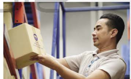
Storage / Inventory MGMT