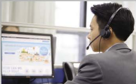
Contact Center/Loan Collection