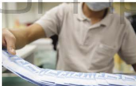
Printing & Mailing