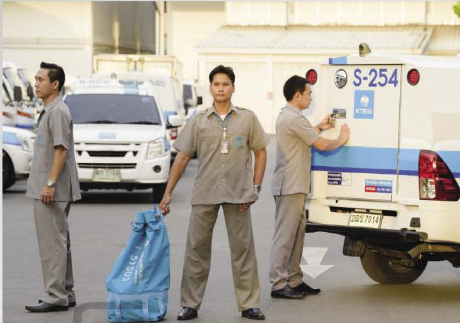
Cash in Transit