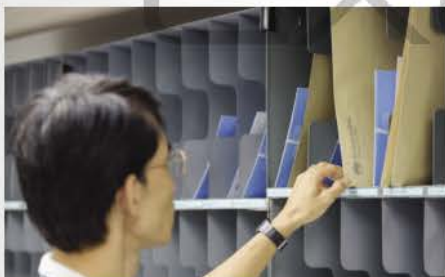
Mail Room MGMT & Messengers