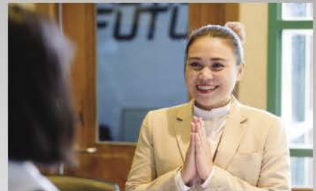
Training Center MGMT