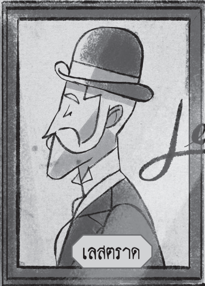
เลสเตอร์รอด