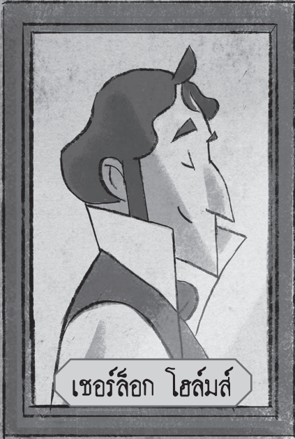
เชอร์ล็อก โฮลมส์