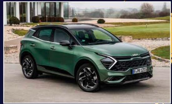
28 พลัดสอนต่างแดน KIA SPORTAGE