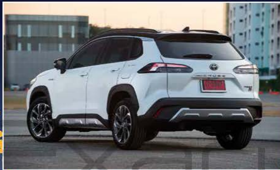
30 ทดลองขับ TOYOTA COROLLA CROSS GR SPORT