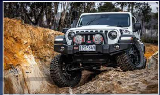
54 แลรถคันรัก JEEP JL RUBICON