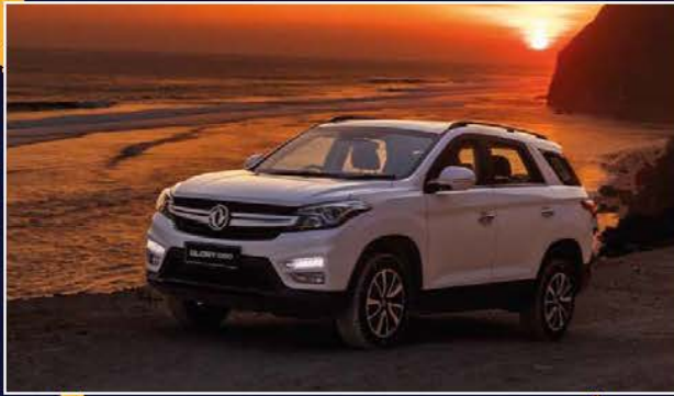
24 เกะกล่องรถใหม่ DFSK GLORY 560