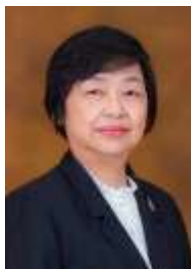
นางทัศนีย์ เปาอินทร์ อธิบดีกรมบังคับคดี

ตัวชี้วัดเชิงคุณภาพ : ร้อยละความพึงพอใจ / เชื่อมั่น ในการเข้ารับบริการของประชาชนและผู้มีส่วนได้เสีย ที่มีต่อกระบวนการบังคับคดี การไถ่ถอน และการวางทรัพย์