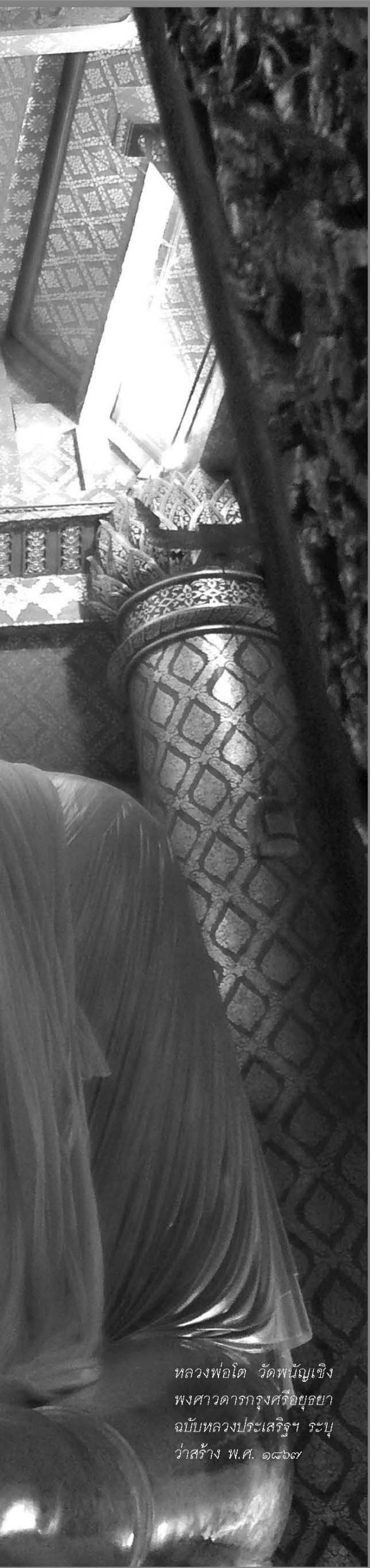
หลวงพ่อดโต วัดพนัญเชิง พงศาวดารกรุงศรีอยุธยา ฉบับหลวงประเสริฐฯ ระบุ ว่าสร้าง พ.ศ. ๑๘๖๗

การกำหนดอายุทางวิทยาศาสตร์ ถือเป็นหนึ่งในวิธีการกำหนดในงานโบราณคดี ไม่ใช่คำตอบสุดท้าย และไม่ใช่คำตอบทั้งหมด เป็นที่ทราบกันดี ในวงวิชาการด้านประวัติศาสตร์ศิลปะ และพระเครื่องว่า อายุสมัยที่แน่นอนของพระพุทธรูปแบบอุทองมาจากหลักฐานเพียง ๒-๓ ชิ้น ได้แก่ พงศาวดารกรุงศรีอยุธยาฉบับหลวงประเสริฐฯ, จารึกหลังพระพุทธรูปปางลีลาที่พิพิธภัณฑสถานแห่งชาติ จันทรเกษม และการค้นพบพระพุทธรูปในกรุปรังค์ วัดมหาธาตุและวัดราชบูรณะ