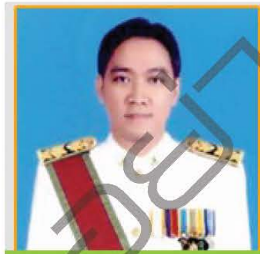
กীরติ รัชโน อธิบดีกรมการค้าต่างประเทศ